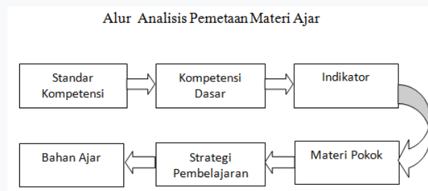
Bild 1. Ablauf des Mapping des Lehrmaterials

Das Mapping des Lernmaterials erfolgt durch Identifizierung und Analyse der einzelnen Kompetenzstandards, Grundkompetenzen und Indikatoren gemäß dem zu untersuchenden Thema. Das Mapping des Lernmaterials wird wie folgt durchgeführt: