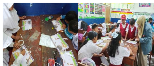
Gambar 2. Pengerjaan karya untuk praktik berbicara

Ketika peserta didik bercerita di depan kelas, guru melakukan penilaian guna mengukur kemampuan berbicara. Dari data yang telah didapatkan saat peserta didik melakukan tes kemampuan berbicara dengan menggunakan metode show and tell , nilai mereka sudah bagus karena mendapatkan nilai rata-rata kelas di atas Kriteria Ketuntasan Minimal (KKM=70). Namun, untuk mengetahui efektivitas pembelajaran setelah