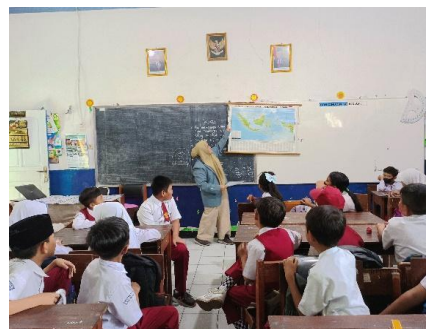
Gambar 1. Pengenalan metode show and tell

Pembelajaran dengan metode show and tell mendukung keterampilan peserta didik dalam proses kreativitas, kinerja (menempel gambar dan berbicara di depan kelas), bertanggung jawab, dan kemampuan berbicara dengan percaya diri. Kreativitas anak dikembangkan saat membuat karya gambar yang nantinya akan dipergunakan untuk media bercerita saat di depan kelas. Tanggung jawab merupakan kemampuan anak menyelesaikan sampai tuntas dan kemampuan berbicara di depan kelas dengan percaya diri.