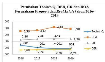
Gambar 1. Perubahan Tobin's Q, DER, CR dan ROA Perusahaan Properti dan Real Estate tahun 2016-2019

tingkat pencapaian perusahaan, yang seringkali terkait dengan harga saham. Nilai perusahaan dipengaruhi oleh beberapa faktor seperti indeks harga saham, tingkat suku bunga, dan kondisi fundamental perusahaan. Kondisi fundamental ini berkaitan dengan keadaan internal perusahaan, seperti kondisi keuangan yang tercermin dari kinerja keuangan perusahaan, yang dapat diketahui melalui analisis rasio keuangan. Para investor mendapatkan gambaran umum suatu perusahaan dengan melihat rasio keuangan sebagai alat evaluasi, karena rasio keuangan mencerminkan tinggi rendahnya nilai perusahaan.