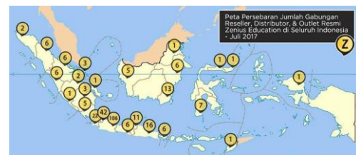
Gambar 2. Peta Persebaran Zenius.

Adapun persebaran Zenius di Indonesia ini sebenarnya sudah sangat luas, bisa diakses dari mana saja. Pada tahun 2017, persebaran Zenius sebagai berikut :