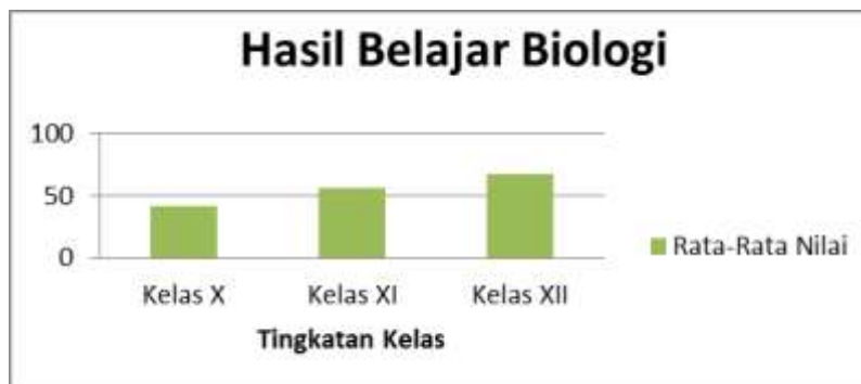
Gambar 3. Data Hasil Belajar Biologi Siswa

Leidong berbeda-beda pada setiap tingkatan kelas. Untuk lebih jelasnya dapat dilihat pada diagram batang berikut.