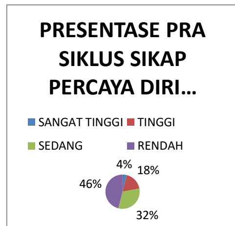
Gambar 4.1. Diagram Presentase Pra Siklus Sikap Percaya Diri Peserta Didik

yaitu 13 peserta didik dengan kriteria rendah, 9 peserta didik dengan kriteria percaya diri sedang, 5 peserta didik dengan kriterian percaya diri tinggi, dan 1 dengan kriteria percaya diri sangat tinggi. Presentase capaian sikap percaya diri peserta didik dituliskan dalam bentuk diagram berikut :