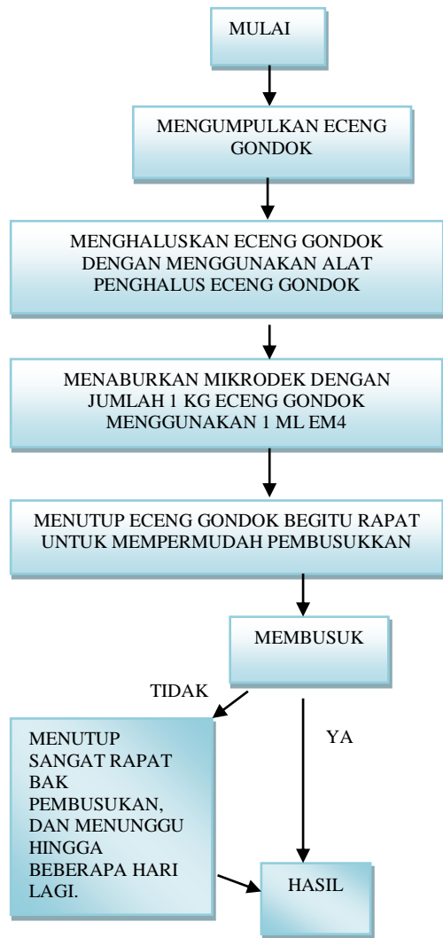
Gambar 3 Diagram pembuatan pupuk eceng gondok