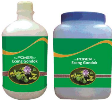
Gambar 7. Hasil pupuk eceng gondok dari Danau Toba

Pupuk organik cair eceng gondok yang di hasilkan di uji kandungan dan dibandingkan dengan persyaratan pupuk organik Permentan No 70 Tahun 2011 (Tabel 1).