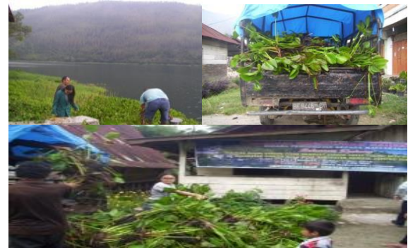
Gambar 2. Pengambilan eceng gondok di Danau Toba dan di bawa ke tempat pelatihan

Tahap persiapan pelatihan dihadiri oleh masyarakat dan kepala desa Naburahan Limbong dilanjutkan dengan pengambilan eceng gondok di pesisir Danau Toba dan meletakkannya di tempat pelatihan. Tahap sosialisasi dilakukan dengan memberikan gambaran umum mengenai tumbuhan eceng gondok dan pemanfaatannya di lanjutkan dengan kegiatan pelatihan. Pelatihan terdiri dari 2 tahap yaitu persiapan pelatihan dan pelatihan.