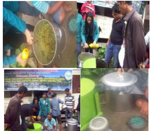
Gambar 5. Memasukkan EM4 pada cacahan eceng gondok dan wadah fermentasi di tutup rapat.

Eceng gondok yang telah halus ditambahkan EM4 dengan kapasitas 1 kg eceng gondok 1 mL EM4 dan ditutup rapat dengan menggunakan plastik (Gambar 5).