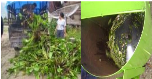
Gambar 4. Mengumpulkan dan pencacahan eceng gondok dengan mesin pemotong.

Eceng gondok yang telah halus ditambahkan EM4 dengan kapasitas 1 kg eceng gondok 1 mL EM4 dan ditutup rapat dengan menggunakan plastik (Gambar 5).