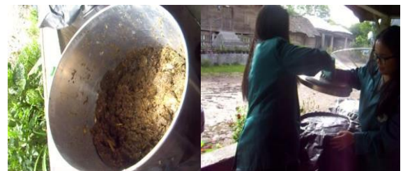
Gambar 6. Hasil pembusukan eceng gondok

Tahapan lanjutan dilakukan monitoring dan evaluasi. Tahap monitoring dilakukan untuk melihat hasil pembusukan yang telah dibuat serta evaluasi keberhasilan yang dilakukan masyarakat (Gambar 6).