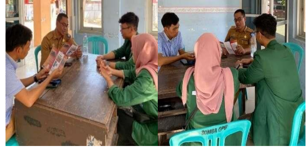
Gambar 3. Diskusi Bersama Lurah dan Seretaris Karang Taruna 21 Juni 2023

(Penetrasi Insight ). Tim PkM melakukan identifikasi masalah mitra lanjutan pada tanggal 21 Juni 2023 untuk membahas solusi yang akan diberikan dan mematangkan konsep program sebagai persiapan sebelum pelaksanaan kegiatan.