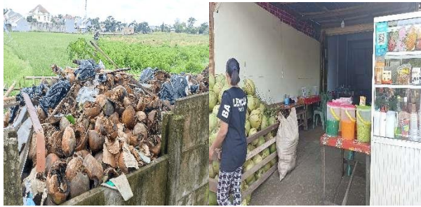
Gambar 1. Penumpukan Limbah Kelapa Jl. Haji Agus Salim 111 25 Januari 2023

Berdasarkan data pada Dinas Perkebunan Provinsi Sulawesi Selatan bahwa rata-rata jumlah kelapa yang dihasilkan di Kabupaten Gowa pada tahun 2017-2020 yaitu sebanyak 1.290 ton. Dari data tersebut dapat disimpulkan bahwa Kabupaten Gowa merupakan salah satu penghasil kelapa terbesar di Sulawesi Selatan. Banyaknya kelapa di Gowa memberi peluang usaha bagi masyarakat khususnya di Sungguminasa untuk mengolah kelapa muda menjadi hidangan yang menyenangkan seperti es kelapa muda. Berdasarkan data yang telah tim PkM kumpulkan, di jalan H. Agus Salim 111, terdapat 16 pedagang es kelapa seperti gambar 1 yang berjejer sepanjang 650 meter dengan jumlah limbah kelapa yang dihasilkan para pedagang yaitu 3,08 ton perminggunya. Limbah kelapa terdiri dari tempurung dan juga sabut kelapa. Sabut kelapa merupakan kulit bagian luar dari buah kelapa sabut kelapa kebanyakan hanya ditumpuk setelah dagingnya diambil (Wahyuni et al., 2022).