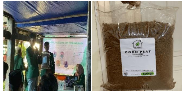
Gambar 9. ( Impactful Echo )

(Impactful Echo) merupakan tahapan akhir monitoring dan evaluasi yang kuat dan mencerminkan dampak positif yang telah dilakukan selama melakukan pelatihan dan pendampingan. Kegiatan evaluasi dilakukan tanggal 30 September 2023.