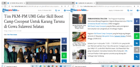
Gambar 10. Artikel pada Media ( Online Tribunnewsultra.com)

Setelah pelaksanaan program PKM-PM, mitra telah menghasilkan ( cocopeat ) dalam kemasan berat 500 gram dan 1 kilogram. Selain itu, mitra telah membuat akun pemasaran dan penjualan di ( Marketplace Facebook dan Shopee), dengan nama "Rumah Cocopeat Gowa". Program PKM-PM yang tim lakukan memiliki dampak bagi mitra, yaitu dari aspek sosial Karang Taruna yang awalnya tidak aktif sejak tahun 2020 hingga pertengahan tahun 2023 diakibatkan ( covid-19 ) menjadi aktif dan produktif kembali pada bulan Juni 2023, kemudian dari Aspek lingkungan limbah sabut kelapa yang dibuang oleh pedagang minuman es kelapa berkurang dari 3,08 ton menjadi 1,88 ton per minggu.