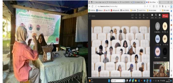
Gambar 8. ( Guiding Journey ) 1 dan 2

mengamati kemampuan mereka dalam mengolah sabut kelapa menjadi ( cocopeat ) serta proses ( packaging cocopeat ) dengan baik. Sementara itu, pendampingan kedua pada tanggal 23 September 2023, tim PkM kembali mendampingi mitra Karang Taruna untuk mengamati kemampuan mereka dalam melakukan pemasaran dan penjualan produk melalui media sosial ( Facebook dan marketplace shopee ), sekaligus pencatatan pembukuan keuangan.