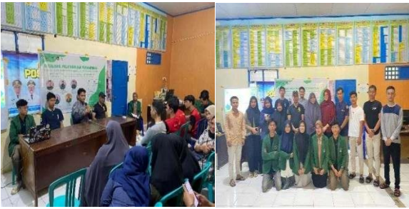
Gambar 6. Tahapan ( Connect and Empower ) 22 Juli 2023

(Connect and Empower) yaitu kegiatan sosialisasi yang dilaksanakan pada tanggal 22 Juli 2023 bertujuan menjelaskan secara rinci tentang pengolahan ( cocopeat ), sehingga anggota Karang Taruna MataAllo memahami gambaran umum mengenai ( cocopeat ).