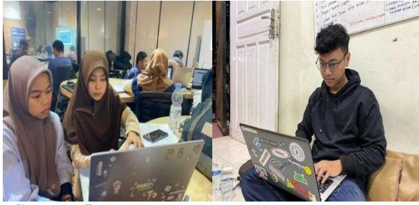
Gambar 5. Pembuatan Buku Pedoman Mitra 17 Juli – 04 Agustus 2023

(Connect and Empower) yaitu kegiatan sosialisasi yang dilaksanakan pada tanggal 22 Juli 2023 bertujuan menjelaskan secara rinci tentang pengolahan ( cocopeat ), sehingga anggota Karang Taruna MataAllo memahami gambaran umum mengenai ( cocopeat ).