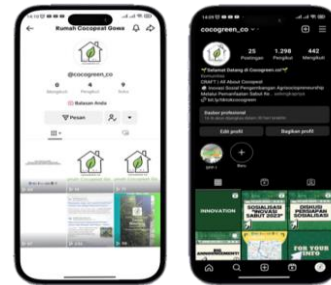
Gambar 4. Akun Sosial Media Program PkM

Setelah dilakukan survei serta diskusi bersama Bapak Lurah dan perwakilan anggota Karang Taruna dilakukan pembuatan akun ( @cocogreen.co ) pada media sosial berupa TikTok dan Instagram yang berisi informasi mengenai pelaksanaan kegiatan PkM dan kegiatan bersama mitra.