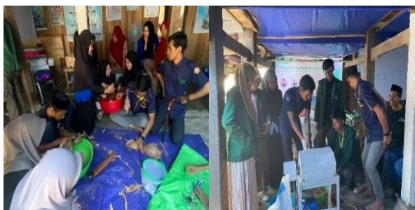
Gambar 7. ( Skill Boost Camp ) 1 dan 2

(Skill Boost Camp) adalah sebuah pelatihan praktis dalam dua tahap. Pada tahap pertama pada tanggal 12 Agustus 2023, Tim PkM mengajarkan cara manual membuat ( cocopeat dan packaging ) kepada Karang Taruna. Sedangkan pada tahap kedua pada tanggal 26 Agustus 2023, Karang Taruna diajarkan cara menggunakan mesin untuk membuat ( cocopeat ), strategi pemasaran melalui media sosial Facebook dan Shopee, dan juga pembukuan keuangan.