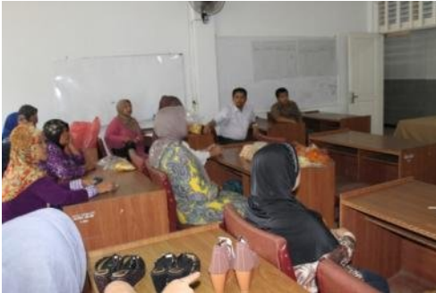
Gambar peserta sedang bertanya seputar pelatihan