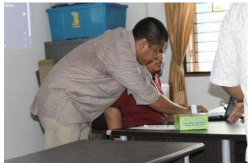
Gambar narasumber sedang mendampingi peserta

Hasil pelaksanaan kegiatan ini adalah semakin mampunya kelompok UPPKS menggunakan internet sebagai alat untuk mempromosikan usahanya. Dan adanya tempat konsultasi kelompok UPPKS di LPM unimed.