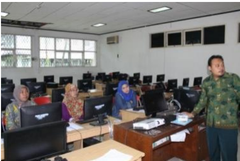
Gambar narasumber sedang mempraktekkan materi