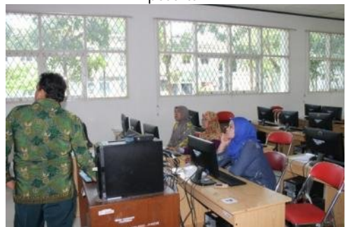
Gambar narasumber sedang menjelaskan materi