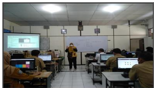
Gambar 6. Suasana pelatihan kelas C