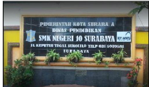
Gambar 1. SMKN 10 Surabaya

Muhadjir Effendy untuk program revitalisasi SMK. SMK Negeri 10 Surabaya (Gambar 1) berkomitmen tinggi mampu menghasilkan lulusan yang kompeten dalam bidang literasi data, literasi teknologi, dan literasi manusia sebagai tenaga kerja produktif dan profesional yang diakui secara nasional dan internasional.