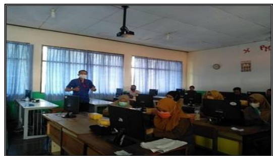
Gambar 5. Suasana pelatihan Kelas B