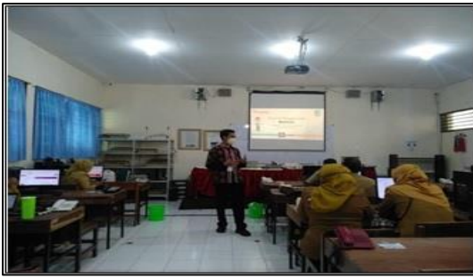
Gambar 7. Suasana pelatihan kelas D