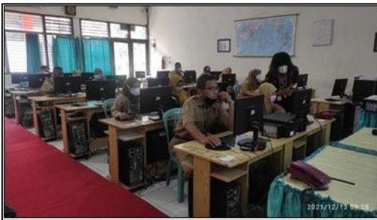
Gambar 8. Suasana pelatihan kelas E

Berikut ini adalah daftar hadir para peserta dimulai dari kelas A, kelas B, kelas C, kelas D dan terakhir adalah kelas E, terlihat pada Gambar 9 hingga Gambar 13.