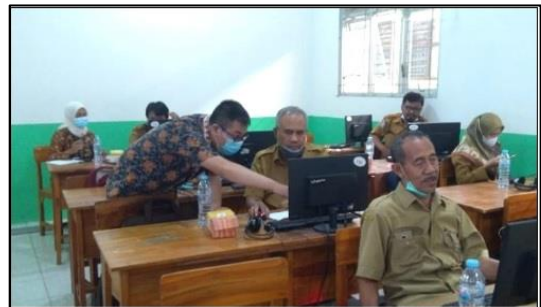
Gambar 4. Suasana pelatihan kelas A

Berikut ini adalah foto dokumentasi kegiatan masing-masing tenaga pengajar di kelas. Pada Gambar 4 hingga Gambar 8 terlihat suasana pelatihan yang dilaksanakan pada 5 ruang laboratorium yang berbeda-beda dengan pendamping yang telah dipaparkan sebelumnya.