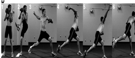
Gambar 1 Teknik dasar pitching set – position

Adapun tahapan gerakan pitching set – position dapat dilihat pada Gambar 1