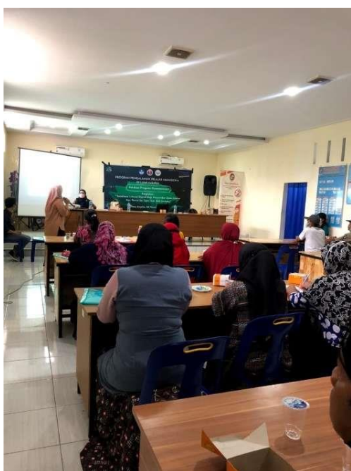
Gambar 11. Sosialisasi Kegiatan Bersama Pemateri 4.

Pemateri yang menjadi sumber informasi tentunya memiliki kecakapan dalam bidang literasi masing-masing sehingga pembahasan yang tiap pemateri paparkan dalam forum kegiatan memiliki manfaat tersendiri bagi masyarakat Desa Amplas, Kecamatan Percut Sei Tuan.