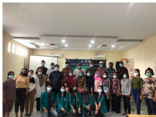
Gambar 12. Foto Bersama (Panitia Pelaksana Kegiatan, Dosen Pembimbing, Pemateri, Staf Desa, dan Masyarakat Desa Amplas, Kecamatan Percut Sei Tuan).