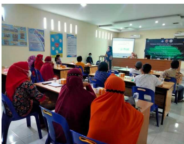
Gambar 10. Sosialisasi Kegiatan Bersama Pemateri 3.