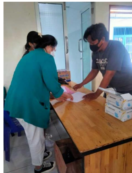
Gambar 7. Peserta Mengisi Daftar Hadir Sebelum Mengikuti Kegiatan.