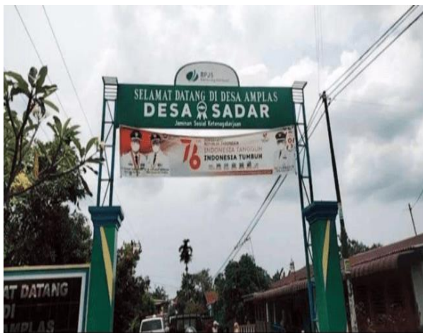
Gambar 1. Desa Amplas Kecamatan Percut Sei Tuan.

Dalam era sekarang, literasi tentu memiliki peran penting dalam memberikan pemahaman kepada masyarakat agar paradigma masyarakat diimplementasikan dengan tindakan yang dilakukan agar memberikan kehidupan yang sejahtera. Nmaun masih banyak masyarakat yang kurang peduli dengan literasi yang seharusnya diimplementasikan dalam kehidupannya sehari-hari.