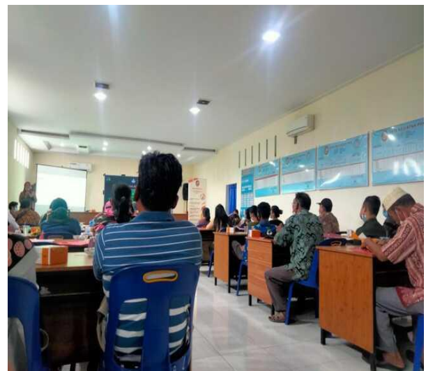
Gambar 8. Sosialisasi Kegiatan Bersama Pemateri 1.