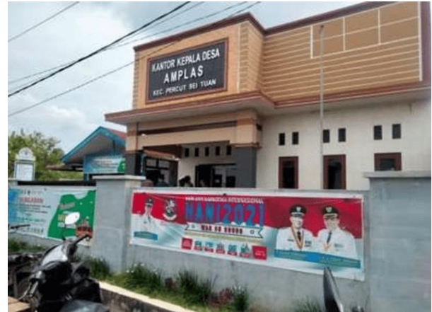
Gambar 2. Kantor Kepala Desa Amplas, Kecamatan Percut Sei Tuan.