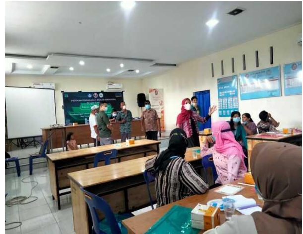
Gambar 5. Ketika Pemateri Menerapkan Metode Training of Trainer (TOT).

bidang literasi yang kami bahas yaitu literasi membaca, literasi stunting , dan literasi digital.