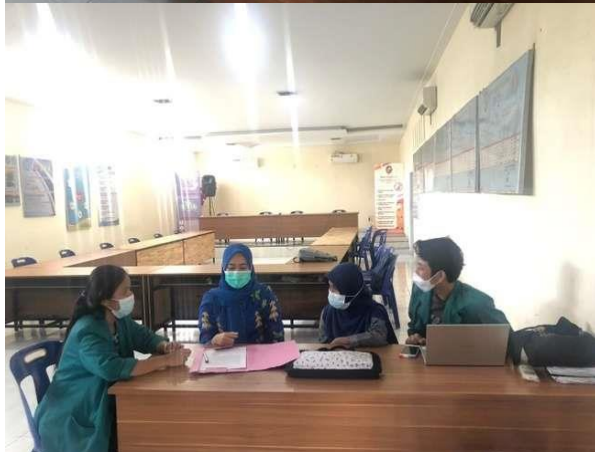
Gambar 4. Diskusi Bersama Salah Satu Staf Desa Amplas, Kecamatan Percut Sei Tuan.

Metode Training of Trainer (TOT) dianggap efektif dalam penyampaian wawasan pengetahuan literasi yang dimiliki masing-masing pemateri karena metode bukan hanya sekedar ceramah tapi memberikan kesempatan bagi masyarakat untuk praktik langsung mengenai literasi tersebut. Sehingga sosialisasi pentingnya literasi yang ada akan lebih dirasakan manfaatnya.