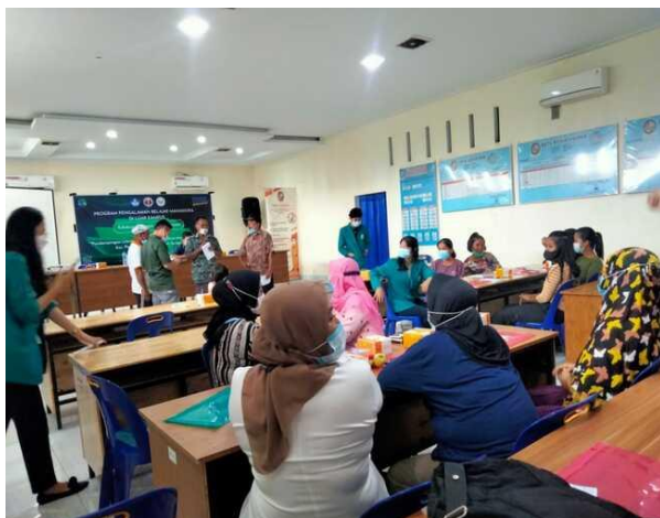
Gambar 9. Sosialisasi Kegiatan Bersama Pemateri 2.