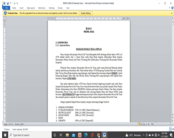
Gambar 3. Sumber Informasi Profil Desa Amplas, Kecamatan Percut Sei Tuan.

bidang literasi yang kami bahas yaitu literasi membaca, literasi stunting , dan literasi digital.