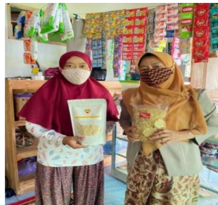
Gambar 7. Sebelah kiri packaging baru , sebelah kanan packaging lama