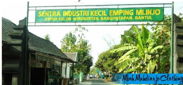
Gambar 1 Sentra Industri Kecil Emping Mlinjo Kepuh Kulon Wirokerten Banguntapan, Bantul

Dalam program KKN IT ini, bekerjasama dengan Mitra UMKM Almeera Emping merupakan UMKM yang bergerak di bidang Produksi Makanan. Almeera Emping berlokasi di Kepuh Kulon Wirokerten, Kecamatan Banguntapan, Bantul. Desa Wirokerten atau Kelurahan Wirokerten merupakan salah satu Kelurahan yang terletak di Kecamatan Banguntapan Kabupaten Bantul. Dengan luas wilayah mencapai 413,83 hektar. Mata pencaharian mayoritas penduduknya adalah petani. Jarak pusat pemerintahan Desa menuju kantor pemerintahan Kecamatan adalah 2KM, jarak pusat pemerintahan Desa menuju pemerintahan Kabupaten adalah 15 KM, sedangkan jarak pusat pemerintahan Desa menuju pemerintahan Provinsi adalah 14 km (Santoso, 2020). UMKM ini tergolong kedalam usaha yang masih merintis karena mereka hanya memproduksi Emping dalam jumlah sedikit. Kendala dalam usaha ini yaitu belum terdaftar di Dinas Kesehatan dan penjualan hanya melalui Offline Store saja.