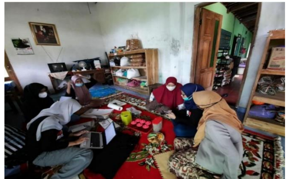
Gambar 2 dan 3 Pembuatan Marketplace Shopee dan Instagram