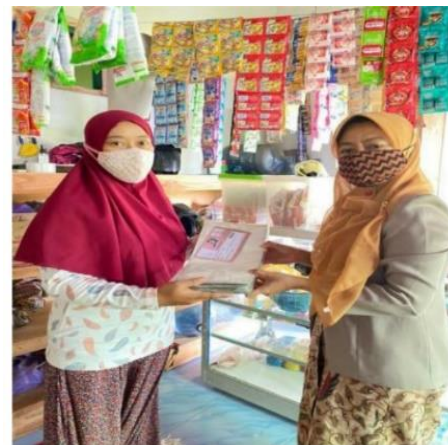
Gambar 6. Penyerahan packing baru UMKM Almeera Emping

Kelompok KKN 164 melakukan perubahan pada kemasan produk almeera emping dengan mengganti bahan kemasan dari plastik biasa menjadi standing pouch yang mana standing pouch tersebut memiliki tingkat ketahanan yang lebih lama jika dibandingkan dengan plastik biasa. Selain itu juga memperbaharui desain dari kemasan produk almeera emping dari yang kurang menarik menjadi desain yang lebih modern. Kemudian dilakukan pemotretan foto produk yang telah di perbarui desain dan kemasannya, dan menggunakan beberapa properti seperti kaca rumbai, bunga kering, dan backdrop yang unik sehingga menghasilkan foto produk yang estetik dan menarik perhatian konsumen.