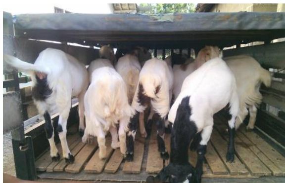
Gambar 4. Kandang Kambing Dan Bibit Ternak Sebagai Demplot.