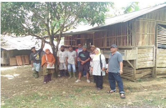
Gambar 5. Kegiatan Monitoring Dari Pelaksana Kegiatan Secara Berkala.