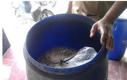
Gambar 2. Pelatihan dan praktek pembuatan silase eceng gondok.