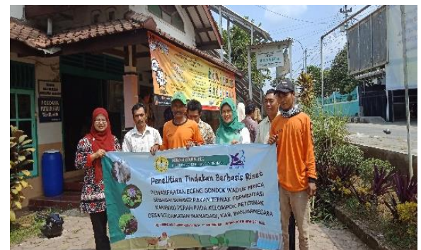
Gambar 1. Kegiatan FGD dan sosialisasi budidaya kambing.