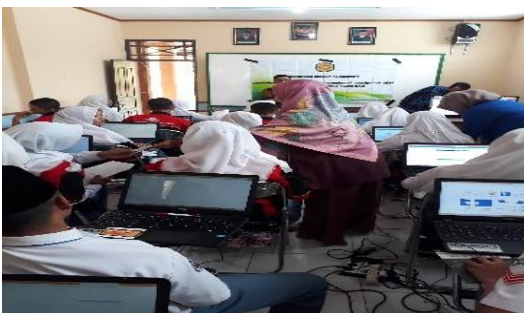
Gambar 1. Foto proses pembuatan blog.

Adapun sebagaian blog yang telah dibuat peserta yang digunakan dalam praktek pembuat blog antara lain: