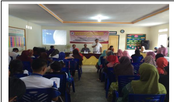
Gambar 2. Kegiatan Bimbingan Teknis