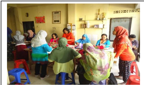
Gambar 3. Aktifitas kelompok pengrajin