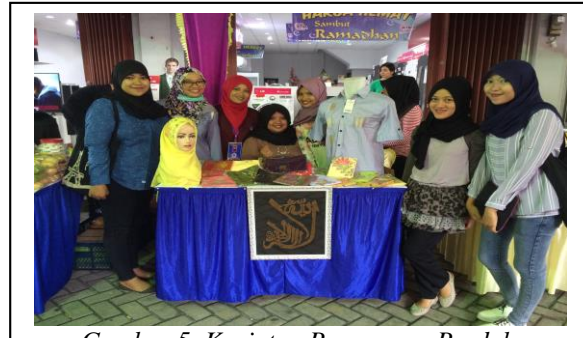
Gambar 5. Kegiatan Pemasaran Produk