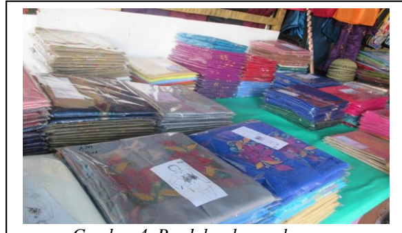
Gambar 4. Produk sulaman karawo