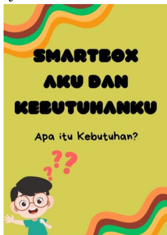
Gambar 3. Tampilan awalan media smartbox

Tahap pengembangan dimulai dengan membuat suatu media atau disebut produk. Produk ini kemudian akan di nilai agar dapat mengetahui apakah produk tersebut layak digunakan atau tidak layak untuk digunakan. Produk dikatakan layak jika tidak ada revisi, tetapi sebaliknya jika dinyatakan belum layak maka produk tersebut memerlukan revisi. Canva adalah aplikasi yang digunakan untuk mendesain. Berikut ini adalah tampilan media pembelajaran smartbox .