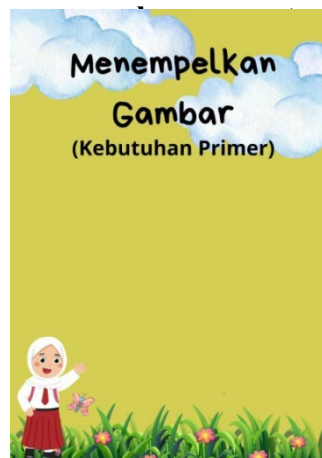
Gambar 6. Tampilan smartbox menempelkan gambar