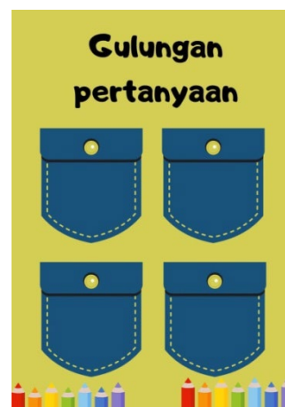
Gambar 5. Tampilan smartbox kuis gulungan pertanyaan