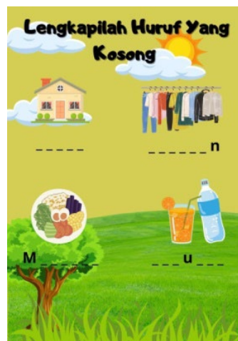
Gambar 4. Tampilan smartbox kuis lengkapilah huruf yang kosong