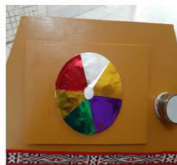
Gambar 1. Media MUZAX

Untuk melihat keberhasilan kegiatan tersebut dilakukan pre-test dan post-test terhadap seluruh siswa kelas VI SDN 104223 Bingkawan.