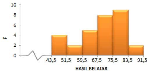
Gambar 4. Histogram data hasil belajar posttest kelas yang diberikan perlakuan model pembelajaran ekspositori (kontrol)

Dari histogram pretest pada kelas yang diberi perlakuan model pembelajara ekspositori diatas menunjukkan bahwa, kemampuan atau pengetahuan awal siswa pada mata pelajaran dasar listrik dan elektronika untuk materi menganalisis teorema rangkaian listrik arus searah masih kurang. Hal itu ditunjukkan nilai tertinggi siswa adalah 48 sedangkan nilai terendah adalah 20. Nilai rata-rata untuk pretest kelas yang diberi perlakuan model pembelajara ekspositori adalah 31,6. Ini menunjukkan bahwa pengetahuan awal siswa pada materi menganalisis teorema rangkaian listrik arus searah masih kurang, maka perlu diberikan perlakuan khusus untuk menaikkan pengetahuan mereka.