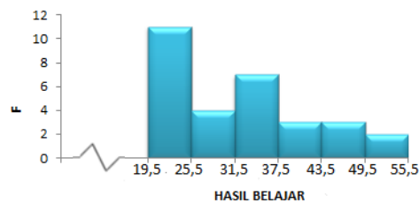
Gambar 1. Histogram data hasil belajar pretest kelas yang diberikan perlakuan model pembelajaran Discovery Learning (eksperimen)

Kelas yang diberikan perlakuan model pembelajaran Discovery Learning pada pertemuan pertama diberi pretest dan pada pertemuan terakhir diberi posttest untuk mengetahui hasil belajar siswa. Penilaian hasil pretest dan posttest kelas yang diberikan perlakuan model pembelajaran Discovery Learning diperoleh rentang skor 0 sampai 100.