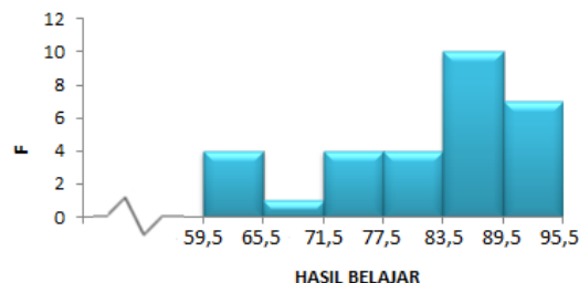
Gambar2. Histogram data hasil belajar posttest kelas yang diberikan perlakuan model pembelajaran Discovery Learning (eksperimen)

Dari histogram pretest pada kelas yang diberikan perlakuan model pembelajaran Discovery Learning (eksperimen) diatas menunjukkan bahwa, kemampuan atau pengetahuan awal siswa pada mata pelajaran dasar listrik dan elektronika untuk materi menganalisis teorema rangkaian listrik arus searah masih kurang. Hal itu ditunjukkan nilai tertinggi siswa adalah 56 sedangkan nilai terendah adalah 20. Nilai rata-rata untuk pretest kelas yang diberikan perlakuan model pembelajaran Discovery Learning (eksperimen) adalah 33,1. Ini menunjukkan bahwa pengetahuan awal siswa pada materi menganalisis teorema rangkaian listrik arus searah masih kurang, maka perlu diberikan perlakuan khusus untuk menaikkan pengetahuan mereka.