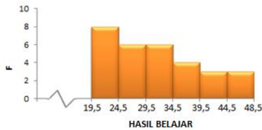
Gambar3. Histogram data hasil belajar pretest kelas yang diberikan perlakuan model pembelajaran ekspositori (kontrol)

Dari histogram pretest pada kelas yang diberi perlakuan model pembelajara ekspositori diatas menunjukkan bahwa, kemampuan atau pengetahuan awal siswa pada mata pelajaran dasar listrik dan elektronika untuk materi menganalisis teorema rangkaian listrik arus searah masih kurang. Hal itu ditunjukkan nilai tertinggi siswa adalah 48 sedangkan nilai terendah adalah 20. Nilai rata-rata untuk pretest kelas yang diberi perlakuan model pembelajara ekspositori adalah 31,6. Ini menunjukkan bahwa pengetahuan awal siswa pada materi menganalisis teorema rangkaian listrik arus searah masih kurang, maka perlu diberikan perlakuan khusus untuk menaikkan pengetahuan mereka.