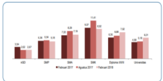
Gambar 1 Tingkat Pengangguran Terbuka (TPT) Menurut Tingkat Pendidikan Tertinggi yang Ditamatkan (persen), Februari 2017–Februari 2018

peluang untuk melakukan kegiatan ekonomi khususnya dibidang usaha. Namun masyarakat Indonesia masih banyak yang kurang menyadari itu, masyarakat banyak yang menginginkan bekerja di perusahaan perusahaan yang ternama demi dipandang keren dan hebat.