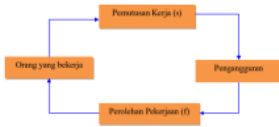
Gambar 1. Transisi Menjadi Pekerja atau Penganggur

Pada Teori Klasik dijelaskan ada dua alasan yang menyebabkan terjadinya pengangguran yaitu: