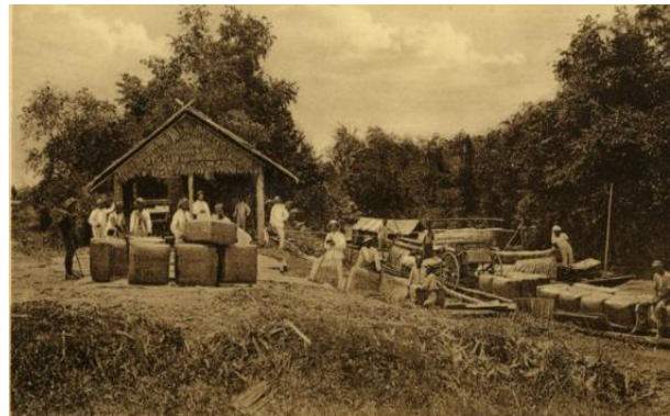
Foto 4. Paket pengiriman tembakau tahun 1879. Nomor Inv. 1402028.

Pada masa lumbung sekitar bulan Oktober sampai Januari, kuli Tamil yang bekerja sebagai kusir pedati, hilir mudik di jalan-jalan perkebunan mengangkut hasil panen yang akan diekspor. Pada tahun-tahun awal pembukaan, kuli-kuli Tamil mengangkut bal-bal tembakau dari lumbung ke sungai yang dapat dicapai oleh sampan-sampan kecil, seperti terekam dalam foto 4 yang diambil tahun 1879.