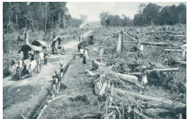
Foto 2. Penebangan hutan untuk membuka perkebunan tembakau di Sumatera Timur tahun 1880-an. Nomor Inv. 80232.

Mengenai pekerjaan membangun jalan dan kanal, kuli Tamil membangun infrastruktur-infrastruktur tersebut di tengah timbunan akar, dahan dan pohon-pohon mati yang sudah ditebas. Sepanjang hari tubuh mereka basah kuyup atau setengah basah, dikerubuti oleh pacet dan nyamuk (Cate, 1905). Dengan kondisi kerja seperti itu tentunya nyamuk malaria setiap saat mengancam jiwa kuli-kuli Tamil. Kondisi kerja yang berat dan tidak sehat yang harus dialami kuli-kuli Tamil terekam dalam foto 2 dan 3.