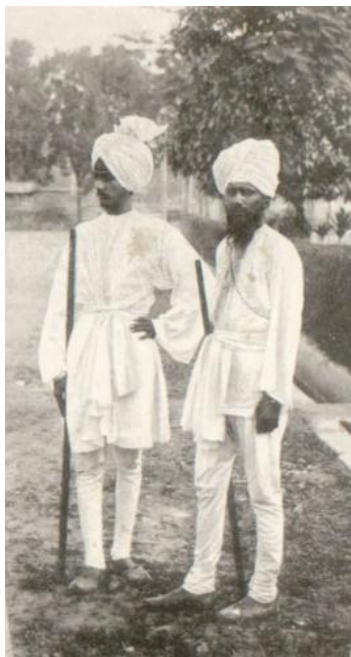
Foto 5. Orang Benggali sebagai opas perkebunan di Sumatera Timur tahun 1879. Sumber: Digital Collections Leiden University Libraries. Nomor Inv. 80263.

Kedudukan ekonomi orang Sikh lebih be-runtung dibandingkan dengan kuli Tamil apabila dilihat dari jumlah penghasilan yang mereka da-patkan. Sebagai opas perkebunan, orang Sikh menerima upah 115 dolar per tahun, jauh lebih besar dari upah para kuli Tamil.