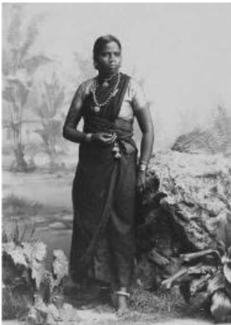
Gambar 7. Perempuan Tamil di Medan tahun 1900. Nomor Inv. 2613.

dan agung. Selendang panjang melilit leher melalui depan dada, dililitkan atau diikat di pinggang supaya selendang tidak terlepas. Badannya yang agung dan tatapan yang tajam mencerminkan model foto masa lalu. Di hidungnya tampak berkilat kancing emas. Singkatnya, penampilannya mencerminkan gaya hidup India dengan dilengkapi asesoris perhiasan kalung dan gelang yang besar serta di kakinya terdapat juga gelang kaki emas. Dari gambar tersebut menunjukkan bahwa perempuan Tamil dalam kehidupan sehari-hari masih mempertahankan identitas budayanya.