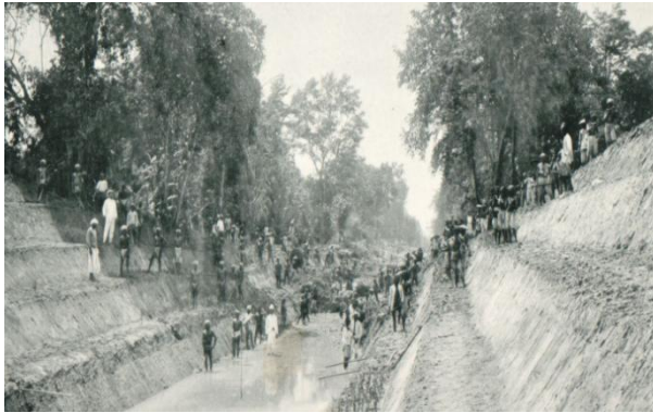
Foto 3. Proses menggali kanal di perkebunan Paja-Bakong, Sumatera Timur tahun 1898. Nomor Inv. 80229.

dapat sewaktu bekerja harus diobati sendiri oleh para kuli (Harahap, 2014: 53).