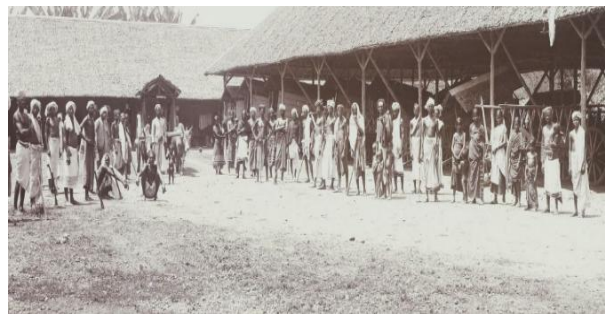
Gambar 8. Kuli-kuli Tamil dengan gerobak-gerobak sapi di salah satu perkebunan tembakau Sumatera Timur tahun 1898. Nomor Inv. 35767.

lapangan. Bangsal-bangsal itu berlantaikan tanah, berdinding papan dan beratap daun nipah, dengan sedikit jendela. Di dalam bangsal hanya ada tempat tidur yang juga digunakan sebagai meja makan. Ruangan bangsal yang pengap, ditambah dengan sisa sampah dan air yang tergenang menambah bau dan kotornya pemukiman para kuli yang menjadi sumber penyakit bagi penghuninya (Bremen, 1997: 121). Di sekitar bangsal terdapat kandang sapi, gudang peralatan, dan candi untuk kuli Tamil beribadah (Cate, 1905). Foto 8 memperlihatkan kuli-kuli Tamil sedang berdiri di belakang bangsal mereka. Foto ini diambil pada tahun 1898-1905.