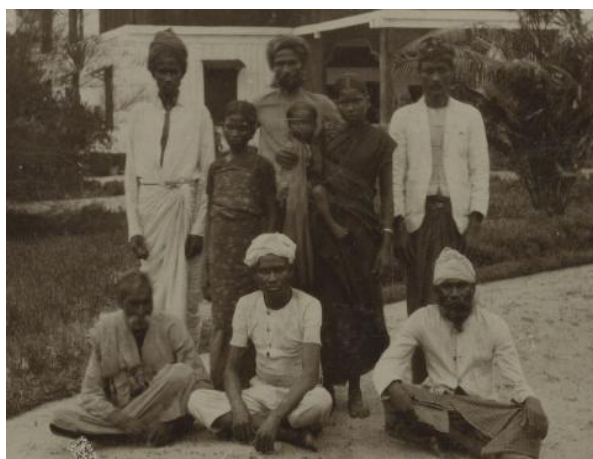
Foto 6. Kuli India di perkebunan tembakau Tandjong Kasan Estate Asahan tahun 1894. Nomor Inv. 90634.

Dari foto 5 terlihat juga penampilan fisik laki-laki Sikh yang sedang menggunakan pa-kaian putih dan celana panjang putih, lengkap dengan turban (ikat kepala) dan memelihara jenggot. Biasanya lelaki India mengenakan dhoti dengan kaos putih, dan ada pula yang memakai sarung dan menutupi badannya dengan selem-pang kain. Penampilan laki-laki India yang me-ngekankan pakaian dhoti dalam kehidupan sehari-hari dapat dilihat pada foto 6 di bawah ini.