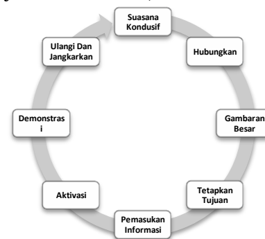
Gambar 1. Tahapan Genius Learning Strategy (Gunawan, 2012:334) Karakteristik pembelajaran Strategi Genius Learning :

hasil proses pembelajaran. Upaya peningkatan ini dicapai dengan menggunakan pengetahuan yang berasal dari disiplin ilmu seperti pengetahuan tentang cara kerja otak, cara kerja memori, neuro-linguistic programming , motivasi, konsep diri, kepribadian, emosi, perasaan, pikiran, metakognisi, gaya belajar, multiple intelligences atau kecerdasan majemuk, dan teknik belajar lainnya. (Gunawan, 2012:2).