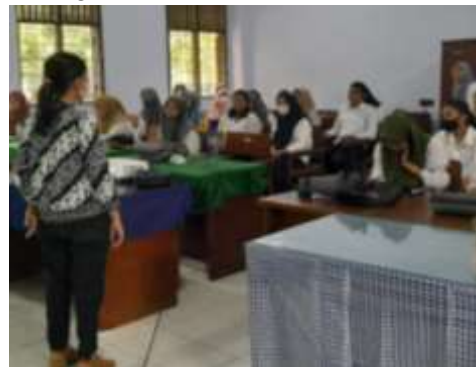
Gambar 1. Pemaparan Penggunaan Buku Petunjuk Praktikum Konsep Dasar Biologi

Sebelum melihat keterampilan menulis mahasiswa, peneliti memberikan pemahaman terlebih dahulu terkait penggunaan buku petunjuk praktikum konsep dasar Biologi.