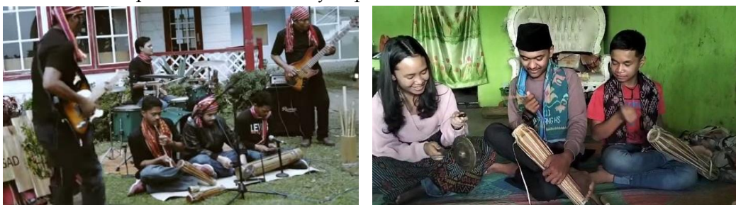
Gambar 4. Pengalaman budaya menggunakan Gendang Lima Sendalanan pada kegiatan di Komunitas Sadakata Art dan Komunitas Lasiganjangan Bara Ras Takal

Komunitas musik tradisional yang ada di Berastagi juga bergerak untuk tetap mempertahankan Gendang Lima Sendalanan . Ialah Komunitas Sadakata Art yang terus berupaya menarik minat generasi Karo dengan cara membuat lagu-lagu dengan menggunakan alat musik tradisional dengan mengolaborasikannya bersama alat musik modern agar sesuai dengan minat generasi muda. Saat ini Sadakata Art sudah membuka kursus belajar Gendang Karo. Ada pula sanggar musik bernama Lasiganjangan bara ras takal yang dibentuk pada tahun 2023. Komunitas tersebut sudah ikut dalam berbagai acara adat masyarakat Karo dan membawakan Gendang Lima Sendalanan dalam setiap acara adat, khususnya upacara kematian.