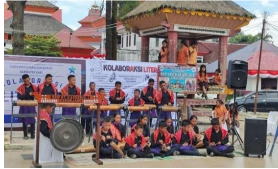
Gambar 5. Pengalaman budaya menggunakan Gendang Lima Sendalanan pada kegiatan Ekstra Kurikuler di sekolah

Sekolah yang ada di Kecamatan Berastagi sudah memiliki ekstrakurikuler musik tradisional. Ekstrakurikuler ini mengajarkan ragam alat musik tradisional Karo. Jika siswa/i ingin mempelajari Gendang Lima Sendalanan , maka akan diajarkan bermain alat musik gung terlebih dahulu. Setelah mahir, selanjutnya bermain panganak , singindungi , singanaki dan yang terakhir sarunai . Melalui ekstrakurikuler yang dilakukan oleh sekolah akan meningkatkan pengalaman budaya setiap generasi Karo. Walaupun tidak mengikuti ekstrakurikuler, siswa lainnya juga akan mengenal, dan setidaknya pernah menyaksikan penggunaan Gendang Lima Sendalanan di sekolah mereka.