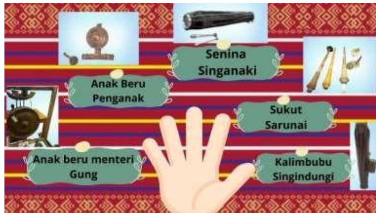
Gambar 2. Analogi jari tangan dengan posisi duduk para pemain musik ( sierjabaten ) Gendang Lima Sendalanan

Analogi jari tangan di atas menggambarkan posisi duduk para pemain musik Gendang Lima Sendalanan . Posisi duduk tersebut tidak boleh sembarangan karena berkaitan dengan sistem kekerabatan yang berlaku dalam etnik Karo. Namun, dengan semakin minimnya penggunaan Gendang Lima Sendalanan , berdasarkan pada paparan informan, pemaknaan tersebut sudah mulai tidak dipahami oleh masyarakat Karo. Hal tersebutlah yang menjadi salah satu kritis identitas Karo saat ini dalam memahami dan melestarikan alat musik tradisional Karo.