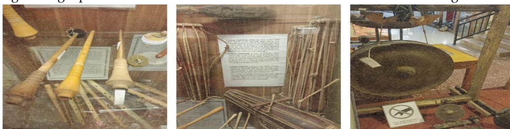
Gambar 1. Sarunai, Singanaki, singinduni, panganak dan gung

Bersangkutanpaut dengan pengalaman memainkan gendang lima sendalanan dalam tradisi Karo, pemain musik Gendang Lima Sendalanan memiliki aturan dalam cara duduk yang menggambarkan sangkep nggeluh kalak Karo (sistem kekerabatan etnik Karo). Sebagaimana bentuk jari manusia, dan sekaligus menggambarkan tata cara duduk setiap kerabat dalam upacara peradatan masyarakat Karo. Secara berurutan mulai dari jempol di sisi kanan merupakan singindungi ( Kalimbubu ), sarunai ( Sukut ), singanaki ( senina ), penganak ( anak beru ), dan gung ( Anak beru Menteri ) di jari kelingking. Sarunai merupakan melodi dalam gendang lima Sendalanan . Namun, melodi harus selalu memperhatikan tempo atau kecepatan pada alat musik singindungi dan juga singanaki sebagai teman bagi pembawa melodi. Selanjutnya penganak , alat musik ini merupakan jantung dalam gendang lima Sendalanan dan yang terakhir merupakan gung . Sukut akan selalu bekerja sama dengan senina dan memperhatikan kalimbubu -nya, dan kalimbubu juga akan selalu duduk di sebelah kanan. Anak beru dalam sebuah upacara adat sangat penting karena untuk menyelesaikan segala acara dalam peradatan akan dilakukan oleh Anak beru , dan Anak beru menteri yang akan membantu anak beru . Oleh karena itu, semua bagian saling melengkapi satu sama lain. Berikut bentuk alat musik tradisional Gendang Lima Sendalanan