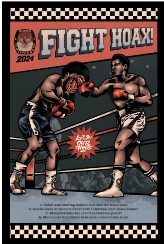
Gambar 3. "Fight Hoax" Digital Color on Satin Fabric, A3+ (Dimas, 2022)

Poster pertama menggunakan 1 headline tegas "Fight Hoax!" menggunakan jenis font freshman . Font ini dipilih karena memiliki karakter tegas. Terletak di bagian atas dengan ukuran besar. Pesannya jelas untuk memerangi hoax . Keterangan dan himbauan yang berisi 4 poin menggunakan font American typewriter . Font ini dipilih karena bentuknya seperti font klasik menyesuaikan gaya visual yang dipilih, vintage .