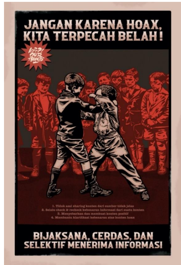
Gambar 4. "Jangan Terpecah" Digital Color on Satin Fabric, A3+ (Dimas, 2022)

Karya poster series yang kedua dengan mengangkat tema "jangan terpecah". Ini merupakan kelanjutan dari poster sebelumnya, berikut hasil karya poster yang kedua