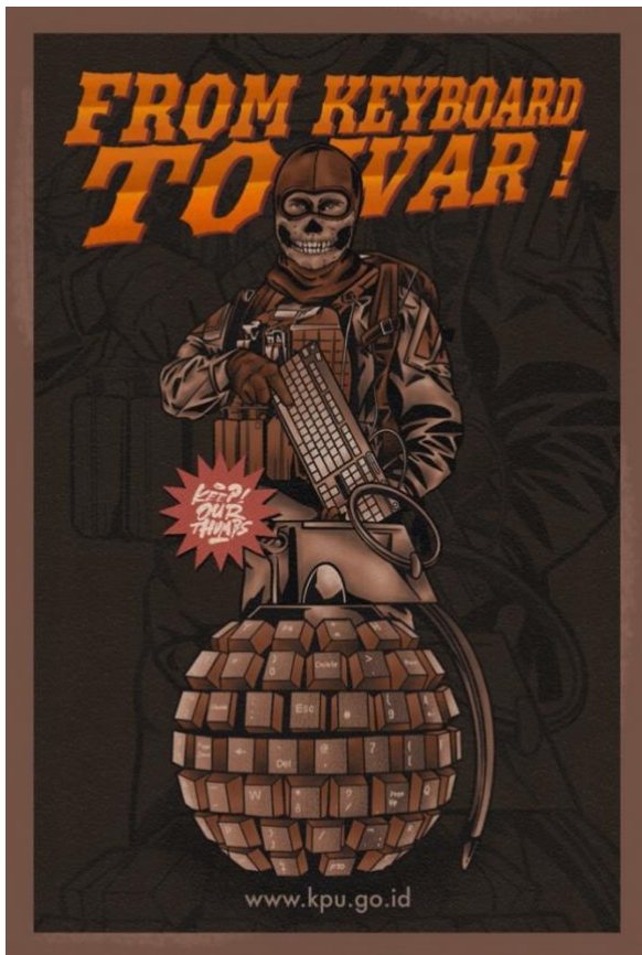
Gambar 5. “ Keyboard Warrior ” Digital Color on Satin Fabric, A3+ (Dimas, 2022)

Poster series yang ketiga dengan tema “ keyboard warrior ”. Tema ini berangkat dari istilah yang sempat ramai di media sosial. Kemudian diimplementasikan pada karya poster yang ketiga. Adapun hasil karya seperti gambar di bawah ini: