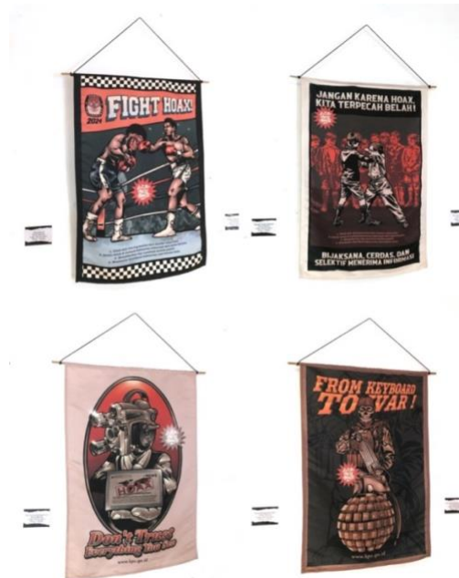
Gambar 2. "exhibition poster series" Digital Color on Satin Fabric, A3+ (Dimas, 2022)

Pengujian tahap test melalui pameran dengan poster cetak. Poster ukuran A3+ dicetak di atas kain satin. Adapun beberapa dokumentasi poster cetak pada pameran terdapat pada gambar di bawah ini.