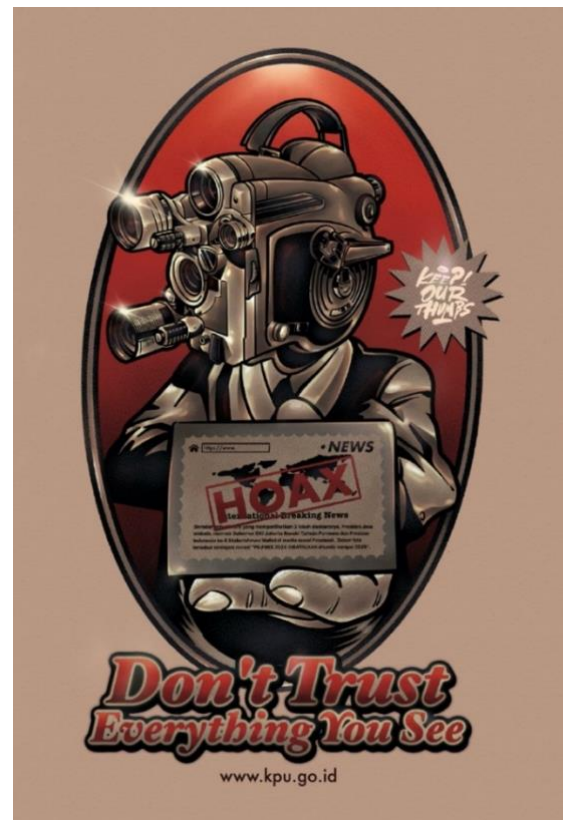
Gambar 6. “ Don't Trust ” Digital Color on Satin Fabric, A3+ (Dimas, 2022)

Poster keempat merupakan poster series yang terakhir pada perancangan ini, dengan judul “ Don't Trust ” mengajak kita untuk bijaksana dan jangan mudah percaya dengan info dan berita yang belum tentu kebenarannya. Berikut hasil karya poster keempat