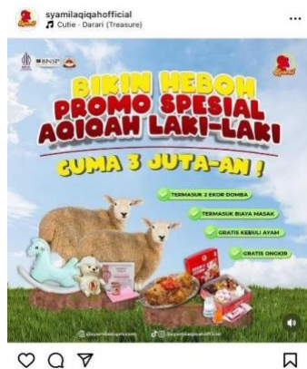
Gambar 3. Publikasi Syamil Aqiqah Promo Spesial Aqiqah Anak Laki – laki.

Melalui Gambar 3, Syamil Aqiqah mempublikasikan promo special aqiqah anak laki – laki dan menginformasikan bahwa promo ini dimulai dengan harga tiga jutaan saja. Hal tersebut menunjukkan bahwa Syamil Aqiqah ini sudah dipercaya dan selalu menawarkan harga yang terjangkau untuk dua ekor domba. Selain itu, setiap pembelian akan mendapatkan gratis kebuli ayam dan ongkos kirim ke seluruh kota di Jabodetabek akan ditanggung secara gratis . Dengan demikian, setiap promosi menunjukkan bahwa menggunakan layanan catering Syamil Aqiqah adalah cara aqiqah dengan mendapatkan banyak keuntungan.