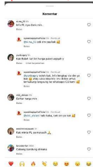
Gambar 1. Respon Pengguna Instagram mengenai promo dan hadiah tahun baru

Dalam salah satu postingan Instagram Syamil Aqiqah yaitu berisi pesan informing mengenai promo akhir dan awal tahun yaitu dengan memberikan hadiah grandprize kepada setiap yang memesan paket catering aqiqah pada bulan desember tahun 2023 hingga januaritahun 2024, selain itu pesan yang di sampaikan adalah persuading untuk membujuk konsumen menggunakan jasa layanan catering karena setiap pemesanan akan mendapatkan hadiah lainnya tanpa diundi untuk setiap pemesanan aqiqah box. Ke- eksklusifan ini membuat konsumen banyak menanyakan harga paket aqiqah yang tersedia dan konsumen mulai tertarik dengan adanya penawaran khusus tersebut.