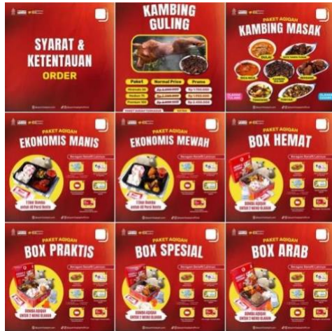
Gambar 7. Foto akun Katalog Syamil Aqiqah

Untuk mendorong pelanggan untuk bertindak, seperti menggunakan layanan jasa catering di Syamil Aqiqah maka dibuat konten voucher diskon atau gratis ongkir agar dapat menarik pelanggan untuk mememesannya. Dengan begitu akan banyak pelanggan yang akan terpicat dengan promosi.