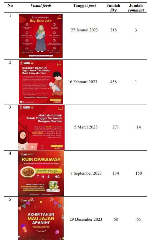
Tabel 1. Sumber : (Instagram Syamilaqiqah, 2024)

Klasifikasi konten visual mendapatkan like terbanyak dengan total 458 merupakan konten visual yang berklasifikasi ilustrasi vektor dan teks. Konten ini mendapatkan like banyak karena karakteristiknya informing terutama dengan memilih objek pendukung dengan deskripsi teks. Syamil Aqiqah memaksimalkan visual dalam konten yang dapat dibenahi dengan baik. Seperti foto yang di posting menampilkan starta warna yang sama, serta mengaplikasikan logo dan hashtag untuk membangun karakter dan citra tertentu. Untuk menjadi pengenal dan pembeda dari merek aqiqah yang lain. Visual yang telah dibuat oleh Syamil Aqiqah sudah melewati proses approved dari tim kreatif nya. Caption yang digunakan memiliki unsur yang berfokus pada penyampaian yang mudah namun informative.