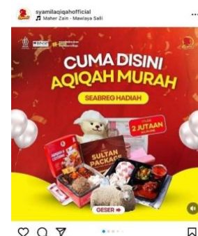
Gambar 2. Publikasi Syamil Aqiqah dalam memposting harga promo dan hadiah setiap bulannya

Dalam postingannya, Syamil Aqiqah mempublikasikan setiap harga promo serta hadiah yang telah ditawarkan kepada konsumen, yang telah di informasikan melalui instagramnya bahwa Syamil Aqiqah ini terus berkembang dan menjadi salah satu layanan jasa catering di Indonesia yang telah dipakai oleh banyak masyarakat hingga sudah di pakai oleh beberapa aktris . Selain itu syamil juga menginformasikan bahwa paket aqiqah disini dimulai dengan harga dua jutaan, konsumen sudah bisa menggunakan layanan jasa catering aqiqah dan mendapatkan hadiah yang telah disediakan setiap bulannya.