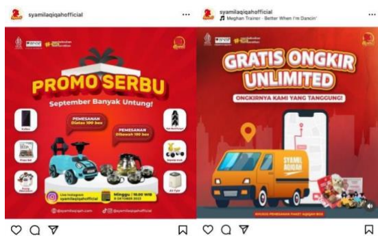
Gambar 8. Foto Syamil Aqiqah tentang promo & gratis ongkir

Untuk mendorong pelanggan untuk bertindak, seperti menggunakan layanan jasa catering di Syamil Aqiqah maka dibuat konten voucher diskon atau gratis ongkir agar dapat menarik pelanggan untuk mememesannya. Dengan begitu akan banyak pelanggan yang akan terpicat dengan promosi.