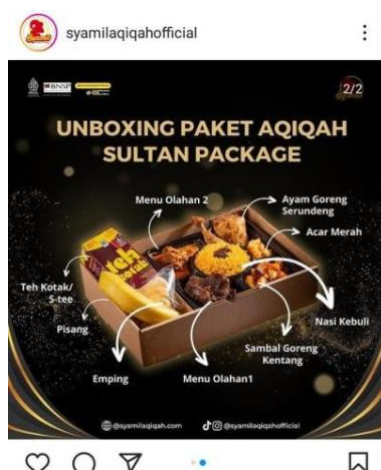
Gambar 5. Foto Produk Syamil Aqiqah

Konsep publikasi juga sebagai solusi bagi perusahaan Syamil Aqiqah. Postingan yang dibuat harus menarik perhatian audiens untuk meyakinkan konsumen menggunakan layanan jasa catering . Foto produk dengan gambar yang mendukung akan membuat konsumen mengenal hasil produk yang ditawarkan serta membuktikan bahwa produk tersebut asli.