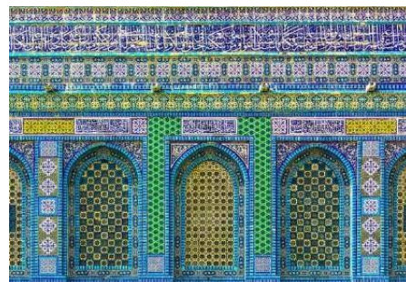
Gambar 2. Mozaik Islam yang Menghiasi Dome of the Rock

Kehadiran seni mozaik dalam bentuk digital meningkatkan aksesibilitas, menghilangkan hambatan fisik seperti lokasi geografis, sehingga lebih banyak orang dapat menikmati dan berinteraksi dengan seni mozaik, dimana salah satu contohnya terdapat pada gambar dibawah ini.