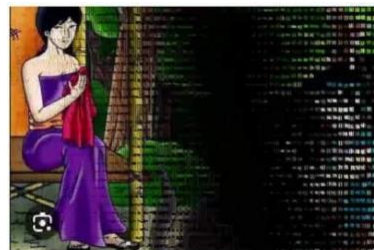
Gambar 6: Interaksi Penonton Dengan Mozaik Sekuensial.

Gambar 5 menunjukkan bagaimana cerita Sangkuriang dihidupkan melalui serangkaian gambar yang disusun secara berurutan, menciptakan efek naratif yang mendalam dan interaktif. Kemudian Interaksi penonton dengan mozaik sekuensial terdapat pada gambar dibawah ini.