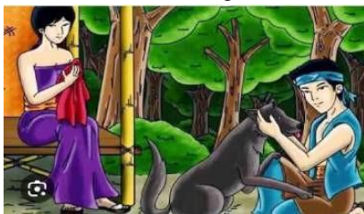
Gambar 4. Studi Kasus Mozaik Hikayat Legenda Sangkuriang dalam Bentuk Gambar Statis dan Transisi Ke Bentuk Digital Sekuensial.

Seni mozaik digital dapat digunakan sebagai alat untuk menyuarakan pesan sosial, politik, atau budaya yang relevan dengan masalah zaman. Berikut ini gambar transisi mozaik hikayat Legenda Sangkuriang dari gambar statis ke bentuk digital sekuensial.