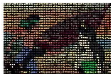
Gambar 7: Penggunaan Teknologi dalam Pembuatan Mozaik Digital.

Gambar 6 menunjukkan bagaimana penonton dapat berinteraksi dengan cerita melalui medium digital, memberikan dimensi baru pada pengalaman visual dan naratif. Adapun penggunaan teknologi dalam pembuatan mozaik digital terdapat pada gambar berikut.