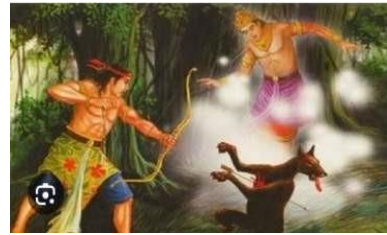
Gambar 5. Transisi Visual dari Gambar Statis ke Dinamis dalam Bentuk Mozaik Sekuensial.

Salah satu contoh paling menonjol dari transformasi ini adalah hikayat Legenda Sangkuriang yang diadaptasi ke dalam seni mozaik sekuensial digital. Proyek ini melibatkan pembuatan serangkaian gambar mozaik yang disusun secara berurutan untuk menciptakan narasi visual dari cerita Sangkuriang. Penggunaan teknologi digital memungkinkan penceritaan yang lebih dinamis, dengan elemen-elemen animasi dan interaktif yang memperkaya pengalaman penonton. Adapun gambarnya sebagai berikut.