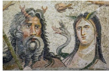
Gambar 1. Artefak Seni Mozaik dari Zaman Romawi

memperkaya ekspresi seni mereka. Seperti halnya seni mozaik pada zaman Romawi yang terdapat pada gambar berikut.