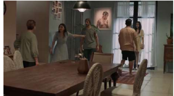
Gambar 11. Anya Datang di Saat Keributan Terjadi

Di tingkat penanda memvisualisasikan Ayu sedang membelai sosok yang tidak terlihat. Pada level signified (petanda) yaitu adegan divisualisasikan melalui sudut pandang CU dan bukaan besar, sehingga fokus ke tangan Ayu yang seolah-olah sedang membelai seseorang. Maksud yang hendak dikomunikasikan adalah Ayu begitu terobsesi dengan Dimas hingga berhalusinasi. Metode perekaman visual pada adegan di atas yaitu CU, fokus ke tangan Ayu yang seolah-olah sedang membelai seseorang.