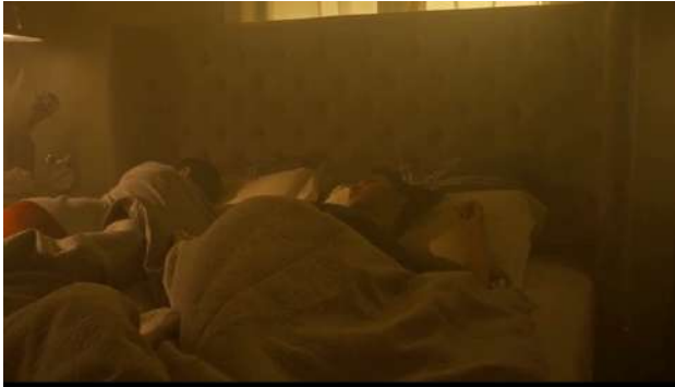
Gambar 1. Adegan Awal dari Film "Selesai"

Di tingkat penanda memvisualisasikan sepasang suami istri di atas ranjang. Pada level signified (petanda) yaitu adegan divisualisasikan melalui sudut pandang MFS dengan tonal hangat. Maksud yang hendak dikomunikasikan adalah memperlihatkan keadaan sepasang suami istri yang masih tertidur di atas ranjang. Metode perekaman visual pada adegan di atas yaitu Medium Full Shot, melalui teknik MFS, jelas terlihat suasana di dalam kamar.