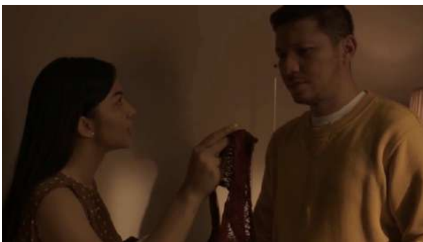
Gambar 2. Ayu Memperlihatkan Sebuah Celana dalam Wanita

Di tingkat penanda memvisualisasikan sepasang suami istri di atas ranjang. Pada level signified (petanda) yaitu adegan divisualisasikan melalui sudut pandang MFS dengan tonal hangat. Maksud yang hendak dikomunikasikan adalah memperlihatkan keadaan sepasang suami istri yang masih tertidur di atas ranjang. Metode perekaman visual pada adegan di atas yaitu Medium Full Shot, melalui teknik MFS, jelas terlihat suasana di dalam kamar.