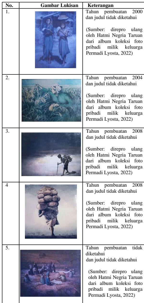
Tabel 4. Karya Lukisan Permadi Lyosta dengan Tema Perempuan Pekerja Tani

Peran dan pekerjaan perempuan tidak hanya sebatas itu. Sebagai makhluk yang memiliki peran ganda, perempuan tentunya memiliki pekerjaan utama: mengurus rumah dan anak. Berbeda dengan laki-laki