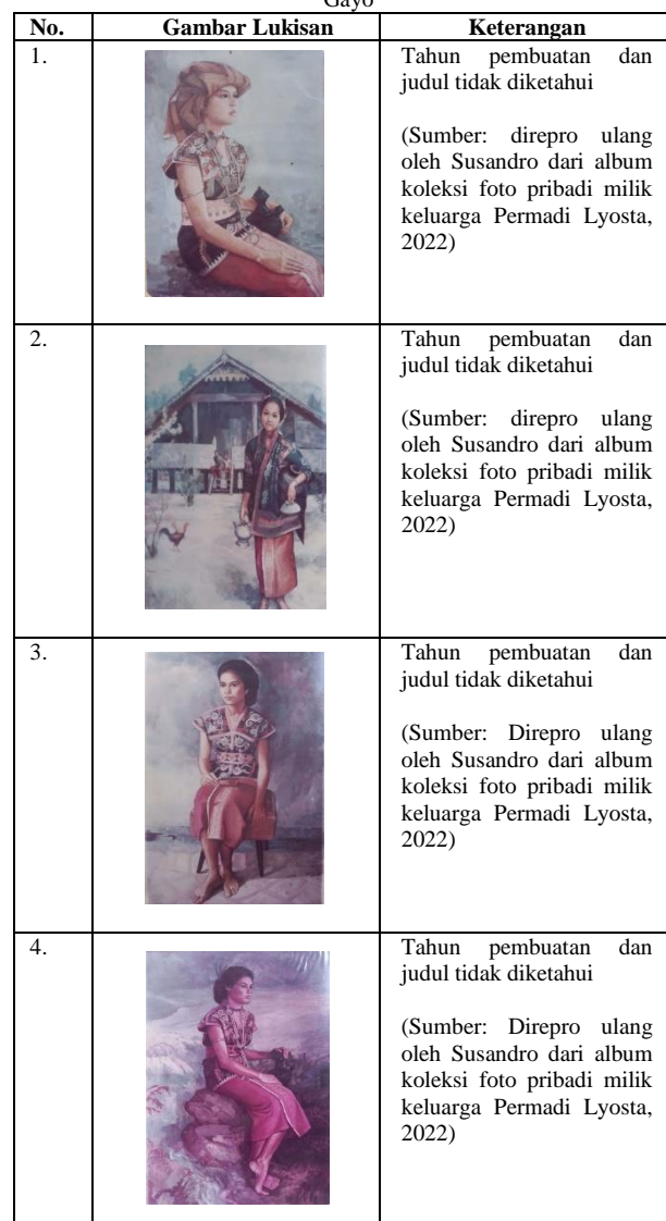
Tabel 1. Karya Lukisan Permadi Lyosta dengan Tema Perempuan Gayo

Hasil penelusuran arsip lukisan dalam bentuk fisik maupun repro foto karya Permadi, didapati lima lukisan yang menggunakan objek visual perempuan berbusana adat Gayo tempo dulu dalam bentuk lukisan potret realis. Keempat lukisan yang tercantum pada tabel di bawah ini tidak hanya memperlihatkan kelihaihan Permadi dalam membuat lukisan realis dengan objek manusia (perempuan), namun juga menampakkan kepekaannya dalam memvisualkan kebudayaan di tanah kelahirannya: Tanah Gayo (Aceh Tengah), terutama pada aspek budaya pakaian adat.