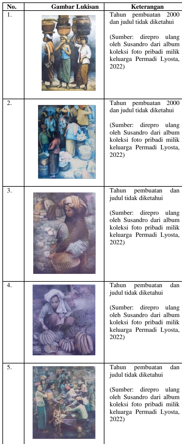
Tabel 3. Karya Lukisan Permadi Lyosta dengan Tema Perempuan Pedagang Pasar

Meskipun kegiatannya di luar rumah, bahkan di depan umum (publik), namun tugas ini tidak bisa dikatakan suatu peran publik seorang perempuan. Peran adalah standar perilaku yang diharapkan karena suatu status tertentu, dalam hal ini perempuan yang berstatus sebagai bakul jamu. Penjual jamu gendong memiliki peran dalam rangka demi kepentingan ngopeni (menghidupi) anak. Anak adalah alasan bagi seorang ibu untuk ikut terjun bekerja (Rostiyati, 2019: 197).