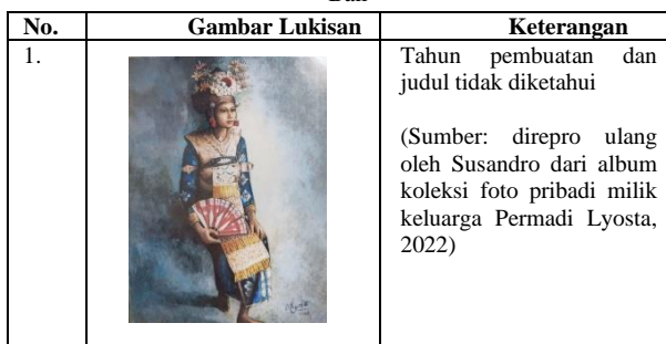
Tabel 2. Karya Lukisan Permadi Lyosta dengan Tema Perempuan Bali

Sebagaimana beberapa lukisan Permadi Lyosta dengan tema perempuan Gayo – beberapa lukisan Permadi yang bertema budaya yang menggunakan visual perempuan dengan pakaian adat khas Bali dan pakaian sehari-hari perempuan Bali – memperlihatkan kembali bahwa Permadi punya perhatian terhadap aspek-aspek etnografi budaya – terutama pada kebudayaan di tempat beliau pernah menetap. Bali bisa dikatakan menjadi kampung maupun rumah kedua bagi Permadi setelah Aceh Tengah. Hal tersebut dikarenakan, Bali tempat Permadi berkiprah sebagai perupa setelah Jogja. Bali juga menjadi tempat pertarungan eksistensi Permadi sebagai perupa LEKRA dan menyandang status sebagai koordinator LEKRA cabang Bali medio abad ke-20 – pada saat iklim politik Indonesia mulai memanas karena pertarungan dua ideologi politik kebudayaan, masa itu.