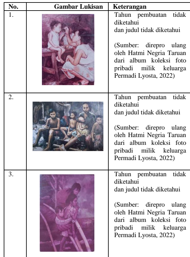
Tabel 5. Karya Lukisan Permadi Lyosta dengan Tema Perempuan Ibu Rumah Tangga

Lukisan Permadi berikutnya memperlihatkan aktivitas dan peranan utama perempuan di rumah sebagai ruang domestik. Gambaran perempuan yang paling sangat umum kita jumpai, terutama di kalangan masyarakat kelas menengah ke bawah. Konstruksi sosial terhadap gender perempuan pada masyarakat kita mengharuskan perempuan memiliki peran sebagai istri sekaligus ibu yang mengurus anak di rumah. Pekerjaan utama perempuan ketika telah menjadi seorang ibu. Kadangkala peran ini dilakukan secara tunggal oleh seorang perempuan yang menjadi istri tanpa bantuan laki-laki sebagai suami di rumah tangga. Ada beberapa penyebab, salah dua, di antaranya: konstruksi sosial terkait gender laki-laki dalam masyarakat Indonesia, khususnya. Serta persoalan ekonomi keluarga yang mengharuskan laki-laki bekerja penuh waktu di luar rumah dan tidak sempat mengurus urusan di rumah, salah satunya mengurus anak.