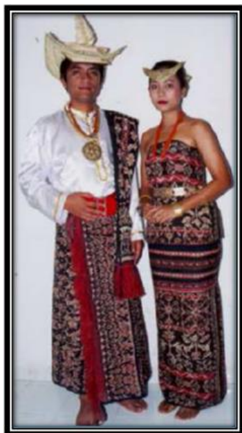
Gambar 4. Sepasang Pengantin Rote Ndao

2). Sebagai mas kawin atau dalam adat Rote disebut disebut dengan belis. Selain itu digunakan juga sebagai penutup sirih. Dalam kebudayaan Rote Ndao kain tenun ikat menjadi salah satu barang yang dibawakan oleh ibu untuk anaknya ketika anaknya tersebut merantau atau yang akan menikah. Perempuan yang memiliki keahlian dalam menenun akan sangat dihargai oleh kaum pria, 3). Sebagai pakaian adat perkawinan.