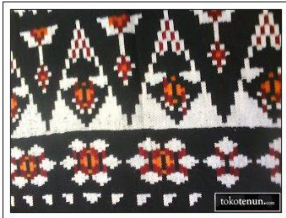
Gambar 8. Motif Lafa Langgak

Merupakan ciri khas seluruh tenun Rote yang berupa kepala selimut yang berupa lambang kombinasi dari lilin dan salib.