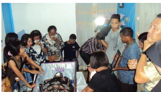
Gambar 5. Penggunaan Lambi Tei untuk Mayat

4). Sebagai alat/ pakaian untuk membungkus mayat.