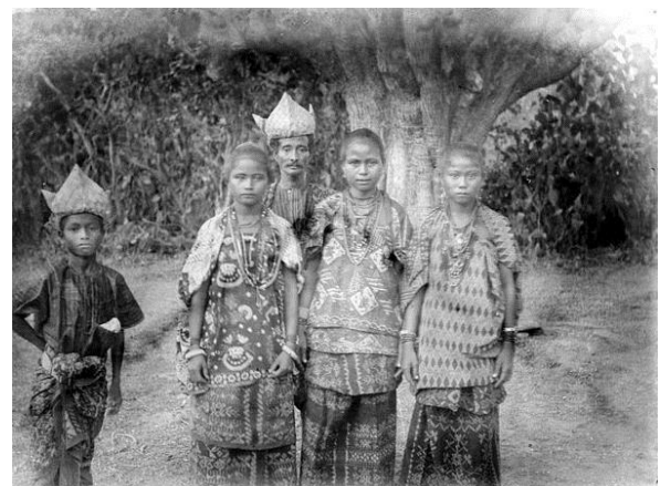
Gambar 6. Raja dan Keluarga Menggunakan Lambi Tei

5). Kain tenun tidak hanya digunakan sebagai penutup jenazah, tidak hanya itu kain tenun dibentang di bagian bawah plafon rumah menutup tempat tidur disemayamkannya jenazah tersebut. Kain tersebut kemudian diserahkan kepada paman (to'o) dari keluarga ibu kemudian disimpan. Tugas dan tanggung jawab adat seorang to'o adalah mengurus seluruh keperluan dari sejak lahir, contohnya pernikahan, kematian, pembagian warisan dan lain-lainnya.. Jika sang paman dari pihak ibu sudah meninggal terlebih dahulu maka tugas itu beralih ke to'o yang masih satu family dari pihak ibu. Hal tersebut diatur dalam norma dan adat istiadat jika melanggar maka terdapat sanksi. (wawancara dengan Gentry Amalo), 6). Sebagai tolak ukur kedewasaan seorang gadis. Zaman dahulu tenun merupakan bagian dari proses akil baligh seorang gadis, selain dapat memasak, berkebun kecil dekat rumahnya serta memelihara babi maka dianggap layak untuk menikah. Karena saat menenun seorang penenun membutuhkan kesabaran, karena menenun membutuhkan waktu yang tidak sebentar, ketekunan, dan lain sebagainya, 7). Sebagai alat denda adat. Dahulu ketika kain masih menggunakan bahan alami, ketika kain belum menjadi komersil kain sangat mahal dan susah didapat, 8). Sebagai Prestise dalam strata sosial masyarakat.