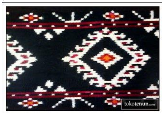
Gambar 9. Motif Henak Anan