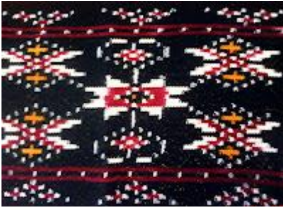
Gambar 13. Motif Mada Karoko