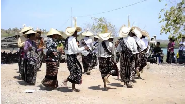
Gambar 3. Masyarakat Rote Menari Menggunakan Lambi Tei

2). Sebagai mas kawin atau dalam adat Rote disebut disebut dengan belis. Selain itu digunakan juga sebagai penutup sirih. Dalam kebudayaan Rote Ndao kain tenun ikat menjadi salah satu barang yang dibawakan oleh ibu untuk anaknya ketika anaknya tersebut merantau atau yang akan menikah. Perempuan yang memiliki keahlian dalam menenun akan sangat dihargai oleh kaum pria, 3). Sebagai pakaian adat perkawinan.