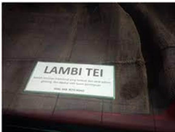
Gambar 1. Lambi Tei yang Terbuat dari Serat Daun Gwang.

Namun tenun ikat dari Rotendao ini sudah ada semenjak ratusan tahun lalu. Tenun ikat memiliki dua macam bentuk yaitu sarung dan selimut. Sarung inilah yang disebut Lambi Tei sedangkan selimutnya disebut lafe tei . Dialek-dialek yang dimiliki masyarakat Rote Ndao berbeda berdasarkan suaranya atau bersifat fonetis. Dialek-dialek Dengka dan Oenale menyimpang lebih banyak dari pada dialek-dialek lainnya. Orang Bilba di wilayah Rote Timur menyebut sarung dengan nama Po, orang Dengka di Rote Barat menyebutnya dengan nama Lani/Lambi, sedangkan orang Ndao menyebut dengan nama Rabi atau Rampi.