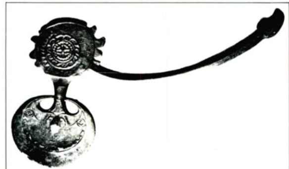
Gambar 2. Sebuah Kapak Perunggu ( Bonza Axe ) dari Rote

Pulau Rote telah mengenal teknologi sejak leluhur mendiami pulau. Pada zaman batu (Paleolitikum) seorang peneliti asal Swis, Buchler melakukan penelitian tentang peralatan yang digunakan masyarakat Rote pada zaman dahulu. Hasil penelitiannya menunjukkan bahwa orang Rote sudah menggunakan alat-alat sejak zaman paleolitikum. Selain itu, ditemukan pula alat-alat dari zaman maleolitikum. Alat-alat yang dimaksud adalah kapak genggam, kapak lonjong, ujung mata panah, pisau, dan lain sebagainya (Melaltoa, 1995: 714).