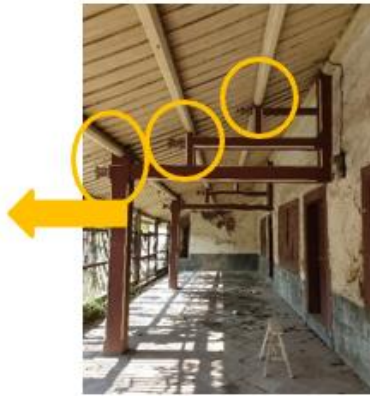
Gambar 11. Kontruksi Kuda-kuda Teras Lantai 1

Kuda-kuda dibuat sederhana tanpa konstruksi tou kung pada bagian atas kolom seperti rumah Tionghoa pada umumnya. Akan tetapi rumah ini memiliki ornamen bunga lotus yang awalnya kuncup dan semakin ke bawah semakin mekar. Bunga Lotus adalah simbol dari kemurnian dan kesempurnaan. Bunga ini tumbuh di lumpur tapi tidak tercemar, sama seperti Budha yang lahir di dunia namun hidupnya mengatasi dunia dan disebutkan bahwa buah Lotus akan menjadi matang saat bunganya mekar, sama seperti kebenaran yang diajarkan oleh Budha segera menghasilkan buah pencerahan. Bunga Lotus juga melambangkan musim panas dan berbuah (Williams, 1976:257).