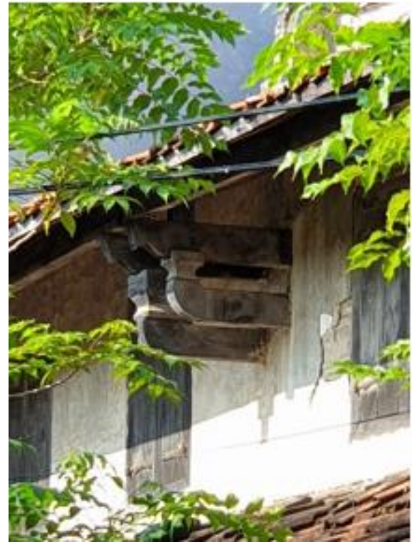
Gambar 13. Konstruksi Tou Kung Penyangga Teritisan Lantai 2

Konstruksi tou kung sederhana ditemukan pada penyangga atap teritisan lantai 2 berupa lengan kantilever pendek.