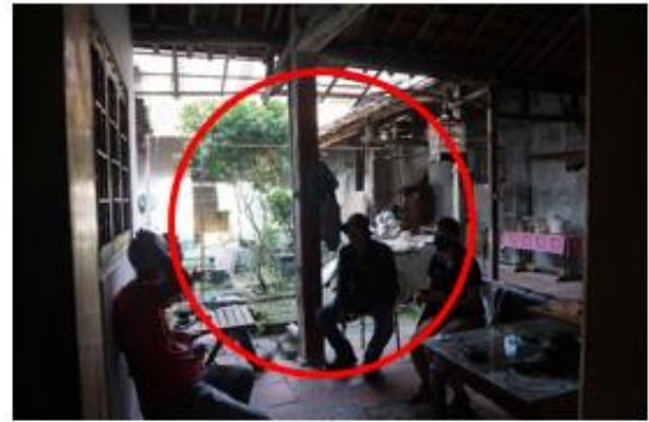
Gambar 4. Courtyard Rumah Tinggal Pecinan Indramayu

Rumah tinggal ini memiliki courtyard (lihat Gambar 4) pada bagian tengah rumah saat ini masih dipertahankan sebagaimana fungsinya seperti dahulu yaitu sebagai sirkulasi udara dan pencahayaan.