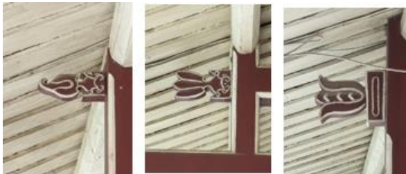
Gambar 12. Ornamen Bunga Lotus Pada Konstruksi tou kung

Kuda-kuda dibuat sederhana tanpa konstruksi tou kung pada bagian atas kolom seperti rumah Tionghoa pada umumnya. Akan tetapi rumah ini memiliki ornamen bunga lotus yang awalnya kuncup dan semakin ke bawah semakin mekar. Bunga Lotus adalah simbol dari kemurnian dan kesempurnaan. Bunga ini tumbuh di lumpur tapi tidak tercemar, sama seperti Budha yang lahir di dunia namun hidupnya mengatasi dunia dan disebutkan bahwa buah Lotus akan menjadi matang saat bunganya mekar, sama seperti kebenaran yang diajarkan oleh Budha segera menghasilkan buah pencerahan. Bunga Lotus juga melambangkan musim panas dan berbuah (Williams, 1976:257).