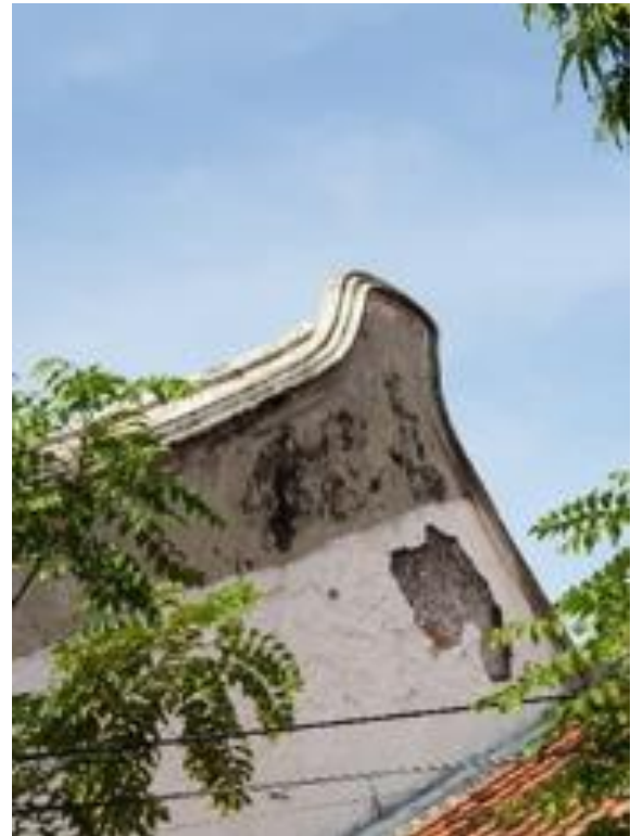
Gambar 9. Dinding Pemikul Segitiga

dinding pemikul berbentuk segitiga sebagai pembatas kiri dan kanan bangunan. Bagian jurai memiliki bentuk yang khas menyerupai daun cemara atau ekor burung walet yang mengarah ke atas.