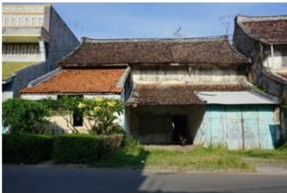
Gambar 3. Rumah Tinggal Pecinan Indramayu

Rumah tinggal ini dibangun pada tahun 1880, berada pada Jalan Cimanuk, Pecinan Kota Indramayu. Masih berfungsi sebagai rumah tinggal dan ditempati oleh generasi paling muda. Seperti tolok ukur arsitektur Tionghoa maka rumah tinggal ini memiliki kriteria Arsitektur Tionghoa, dapat dilihat sebagai berikut: