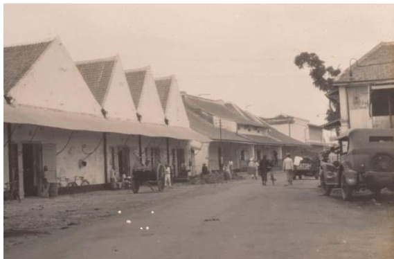
Gambar 1. Pecinan Indramayu 1937

Penelitian ini bertujuan melakukan pemetaan bangunan dengan pengaruh budaya Belanda dan Tionghoa khususnya pada kawasan Pecinan Kota Indramayu dan mengidentifikasi kondisi bangunan bersejarah saat ini untuk mengklarifikasi seberapa banyak pengaruh budaya Tionghoa yang ada di Kawasan Pecinan Indramayu.