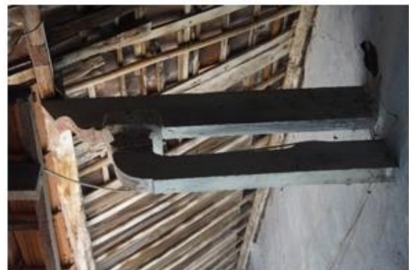
Gambar 6. dou gong Rumah Tinggal Pecinan Indramayu

Struktur terbuka yang merupakan konstruksi konsol penopang rangka atap disertai ragam hias yang disebut dou gong dengan tipe Fukien selalu ada pada setiap arsitektur Tionghoa.