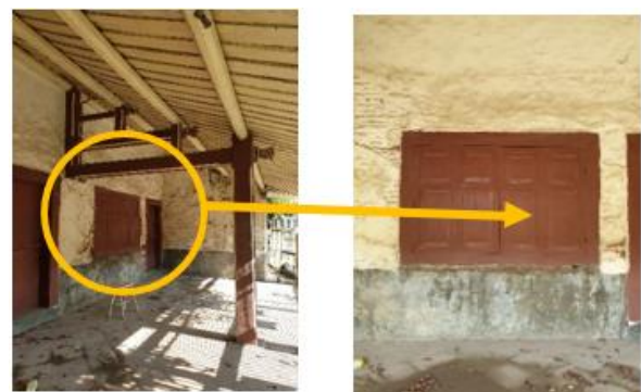
Gambar 14. Aplikasi Warna Merah pada Kolom, Kuda-kuda, Pintu dan Jendela

Dilihat dari bentuk jendela lebar yang ada di lantai 1, diduga rumah ini dulu berfungsi juga sebagai tempat usaha.