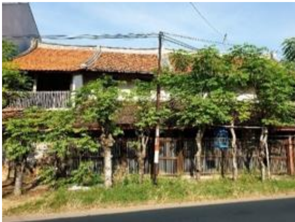
Gambar 8. Fasade Rumah tinggal No.10

Rumah tinggal ini dibangun pada tahun 1870, berada pada Jalan Cimanuk, Pecinan Kota Indramayu. Awalnya berfungsi sebagai rumah tinggal dan tempat usaha, saat ini hanya berfungsi sebagai rumah tinggal dan ditempati oleh generasi muda saat ini.