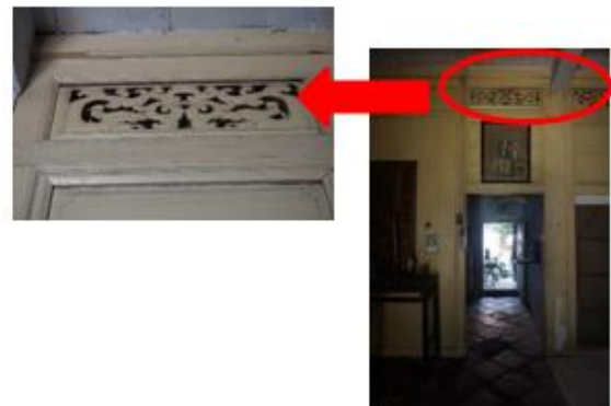
Gambar 5. Ragam Hias Pada Bovenlict Rumah Tinggal Pecinan Indramayu

Tolok ukur yang kedua ini berupa elemen struktural yang terbuka disertai ragam hias teridentifikasi pada rumah tinggal ini, seperti pada bovenlict pintu. Pada rumah ini terdapat ragam hias bergambarkan naga dan phonix .