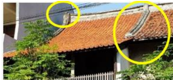
Gambar 10. Jurai Atap Seperti Ekor Burung Walet