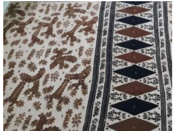
Gambar 7. Tapak Kudo

Gambar motif rangkiang diatas ialah batik tulis klasik digunakannya motif ragam hias yang digunakan adalah bentuk dekoratif motif alam juga benda, memiliki ornamen utama yaitu rangkiang yang sudah melalui proses stilasi atau penyederhanaan, ornamen pelengkap batang dan bunga dan isen-isen garis dan titik. Motif ini terinspirasi dari rangkiang rumah gadang di Minangkabau.