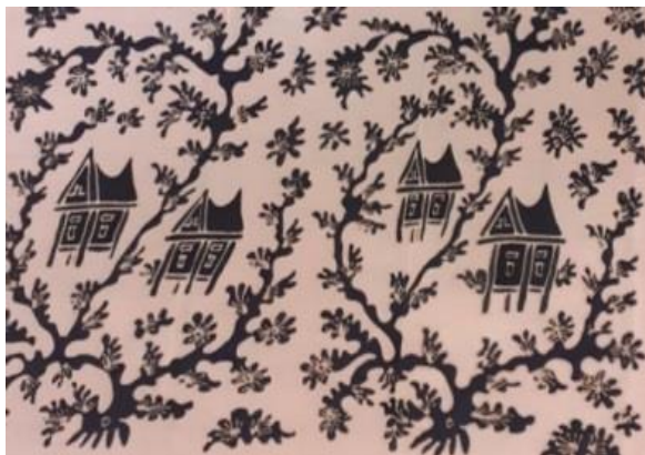
Gambar 6. Rangkiang

Gambar motif batik tubuhan lauik adalah batik tulis, menggunakan motif ragam hias berbentuk naturalis, dekoratif berupa motif alam, memiliki ornamen utama yaitu tumbuhan rumput laut yang sudah melalui proses stilasi atau penyederhanaan dan ornamen pelengkap ubur-ubur juga isen-isen di bagian dalam berupa garis dan titik. Motif ini beridekan dari keindahan laut yang harus terus dilestarikan keberadaannya, karena maraknya kerusakan alam di dasar laut.