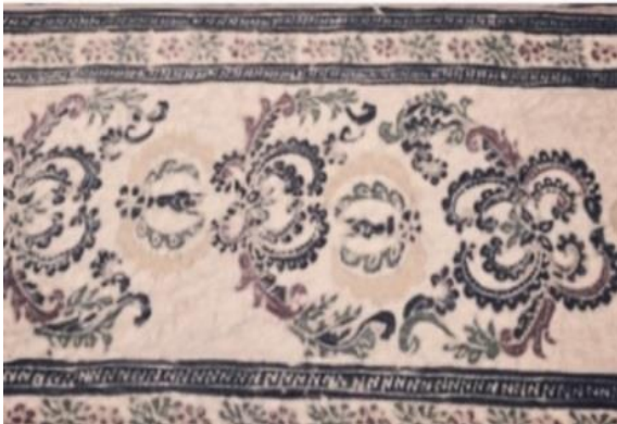
Gambar 10. Liek Kaluak Paku dan Padi

Gambar motif bunga sawit ialah batik tulis klasik menggunakan motif ragam hias naturalis, geometris, motif alam, benda, memiliki ornamen utama yaitu motif bunga sawit yang sudah melalui proses stilasi atau penyederhanaan, ornamen pelengkap yakni bentuk bidang segi empat diamond dan isen-isen bentuk garis dan titik. Motif ini terinspirasi dari kekayaan sektor pertanian di Kabupaten Dharmasraya yang mana memang mayoritas masyarakat Dharmasraya selain tanaman pohon karet juga memiliki kebun kelapa sawit untuk mata pencaharian mereka. Motif bunga sawit juga sudah melalui proses stilasi atau penyederhanaan.