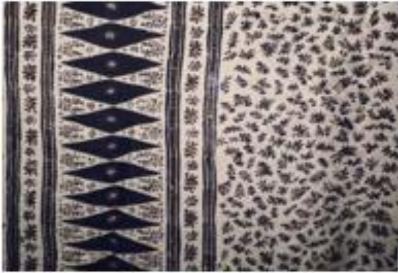
Gambar 9. Bunga Sawit

melatar belakang jika tumbuhan pohon karet banyak ditanam dan hidup di sana.