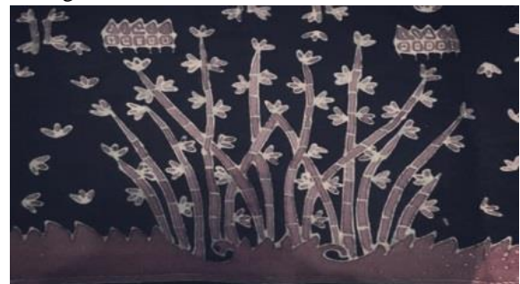
Gambar 12. Rumah Gadang dan Bambu

Menurut Oktora, dkk (2019: 135) mengatakan bahwa “...motif burung hong merupakan motif khas batik zaman dahulu, burung hong sangat lekat dengan kehidupan warga tiongha sering dijadikan dekorasi pernikahan diasandingkan dengan naga dan menjadi simbol hubungan mesra antara suami istri. Pemaisuri kaisar China dan putri-putri istana pun turut menggunakan burung hong sebagai motif utama di pakaian untuk perayaan hari besar China, terinspirasi dari legenda kahaisar China.