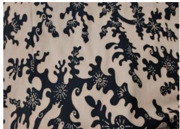
Gambar 4. Kiambang Batauiik

Berdasarkan pengamatan dari penulis motif batik citra erat kaitannya dengan adat, budaya daerah dan lingkungan sekitar Dharmasraya. Motif batik tanah liek citra memiliki dua unsur yaitu ornamen utama dan isian atau isen. Berikut adalah bentuk motif batik tanah liek citra yaitu sebagai berikut: