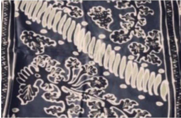
Gambar 13. Kiambang Batauik Lereng

proses stilasi atau penyederhanaan, ornamen pelengkap yakni bentuk motif bambu dan isen-isen bentuk garis dan titik. Motif ini beridekan dari bentuk rumah gadang yang memang rumah gadang sendiri adalah icon dari Provinsi Sumatera Barat. Motif bambu beridekan dari alam bentuk flora.