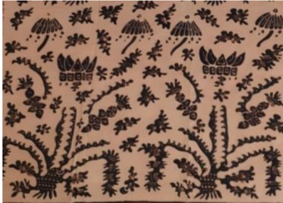
Gambar 5. Tumbuhan Lauik

Gambar motif batik tubuhan lauik adalah batik tulis, menggunakan motif ragam hias berbentuk naturalis, dekoratif berupa motif alam, memiliki ornamen utama yaitu tumbuhan rumput laut yang sudah melalui proses stilasi atau penyederhanaan dan ornamen pelengkap ubur-ubur juga isen-isen di bagian dalam berupa garis dan titik. Motif ini beridekan dari keindahan laut yang harus terus dilestarikan keberadaannya, karena maraknya kerusakan alam di dasar laut.