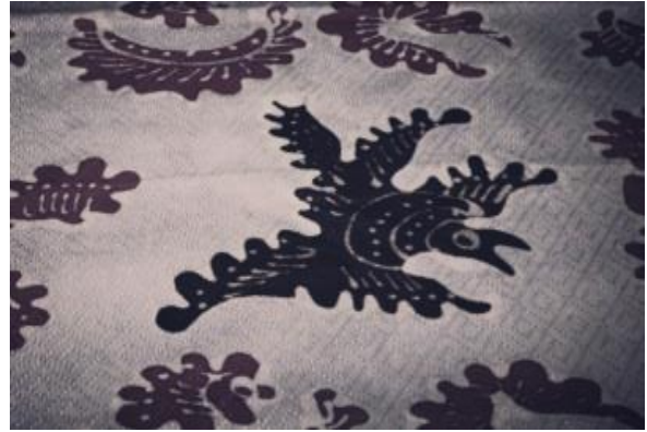
Gambar 11. Burung Hong

Motif kaluak paku dan padi adalah batik tulis menggunakan motif ragam hias naturalis, motif alam, memiliki ornamen utama yaitu motif keluk paku yang sudah melalui proses stilasi atau penyederhanaan, ornamen pelengkap yakni bentuk padi dan isen-isen bentuk garis dan titik. Motif ini terinspirasi dari alam sekitar yang masih banyaknya tumbuhan liar paku hutan, dan padi sebagai ornamen pelengkap yang mengartikan pangan, karena setiap tahunnya Kabupaten Dharmasraya memiliki event panen tahunan yang mana memang di Kabupaten Dharmasraya juga banyak masyarakat yang bertani tumbuhan padi.