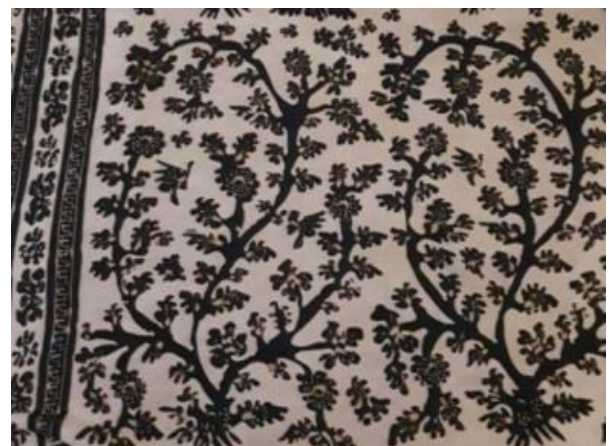
Gambar 8. Pohon Karet

Motif tapak kudo adalah batik tulis klasik, menggunakan motif ragam hias naturalis, geometris, motif alam dan benda, memiliki ornamen utama yaitu tapak kuda yang sudah melalui proses stilasi atau penyederhanaan, ornamen pelengkap yakni bentuk bidang segi diamond dan isen-isen bentuk bunga, garis dan titik. Motif ini terinspirasi dari tapak kuda yang biasa menjadi salah satu icon di Sumatera Barat ketika sedang berlibur, banyak masyarakat yang menarik kuda menjadikan kuda sebagai sarana untuk berkeliling kota, salah satu budaya yang memang sekarang sudah jarang untuk dijumpai, hanya di tempat-tempat tertentu saja kita dapat menjumpainya.