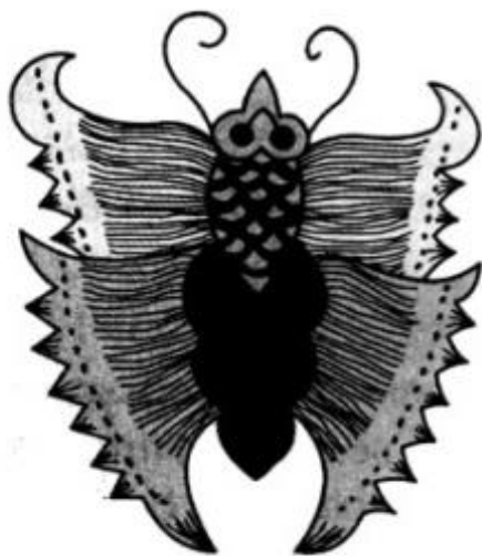
Gambar 1. Ornamen Kupu-Kupu pada Batik Semen Lung

Kusrianto (2013: 05) "motif batik memiliki 2 pembagian yaitu: Ornamen motif yaitu disebut ornamen utama dan pelengkap atau untuk pengisi bidang, dan isen-isen batik yaitu: (1). Ornamen utama atau ornamen pokok dalam batik berbentuk stilasi yang berasal baik dari benda alam, hewan ataupun yang lain yang melambangkan sebuah makna yang dalam, memiliki sebuah filosofi, seperti ornamen lidah api, meru, pohon hayat dan lainnya, memiliki ukuran yang cenderung besar dan dominan dari motif lainnya.