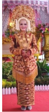
Gambar 3. Model 1