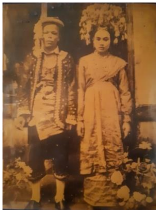
Gambar 1. Model Asli Busana Pengantin Tradisional Pariaman tahun 1950

Busana pengantin wanita di Minangkabau, khususnya di daerah pesisir (Pariaman) mempunyai keunikan yang diinterpretasikan sebagai identitas budaya khas daerah Minang. Pakaian adat pengantin Pariaman ditinjau dari perspektif adat Minangkabau"akan memperlihatkan pesandan nilai budaya masing-masing seperti ekonomi, sosial, politik dan"keagamaan. Pesan tersebut akan dapat diketahui"melalui simbol, warna dan ragam hias pada pakaian. Kelengkapan pakaian adat pengantin wanita itu sendiri yaitu terdapatnya sunti ang (penutup kepala), baju dan kain songket, dan dilengkapi dengan aksesoris guna menambah kesan keindahan pada pakaian tersebut (Asnan, 2003: 23).