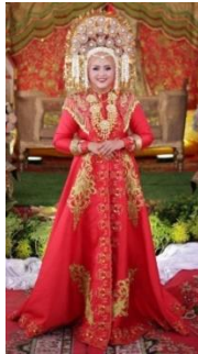
Gambar 4. Model 2