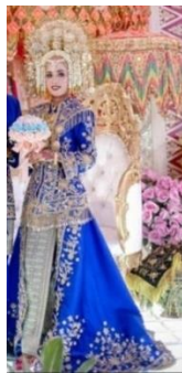
Gambar 5. Model 3