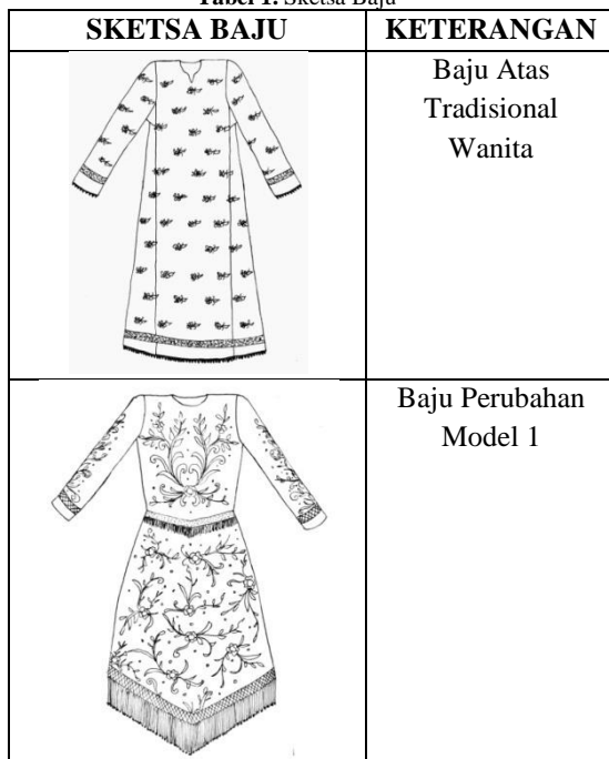
Tabel 1. Sketsa Baju