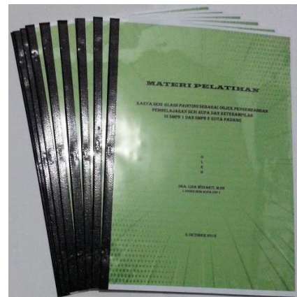
Gambar 9. Makalah Pelatihan

Mempersiapkan semua keperluan pelatihan untuk setiap peserta berupa; makalah, peralatan administrasi untuk keperluan pencatatan, bahan dan alat praktikum untuk mengaplikasikan pengetahuan yang dimiliki dalam bentuk karya. Penyajian materi dalam bentuk penyuluhan untuk meningkatkan pemahaman peserta pelatihan terhadap materi PKM ini. Memperbanyak makalah materi pelatihan (teori)