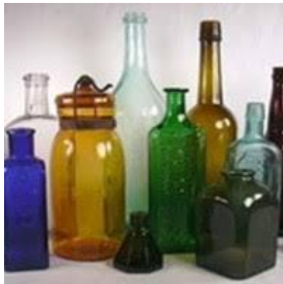
Gambar 3. Glass Painting

Kita dapat menggunakan benda benda yang terbuat dari kaca disekitar rumah kita misalnya: kaca datar, Gelas, piring, stoples, botol bumbu, botol minuman, tempat selai, dll. Pilihlah yang bentuknya menarik & artistik. Pilihlah permukaan kaca yang masih bagus, benda atau kaca yang sudah banyak goresannya atau buram sebaiknya jangan dipakai, karena akan mengurangi keindahan.