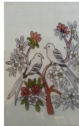
Gambar 7. Proses Pengecatan

Biarkan gambar pola mengering sejenak, dan kemudian dilanjutkan dengan mengisi bidang gambar yang telah di buat di permukaan kaca tersebut. Pengecatan dilakukan secara bertahap dengan Cat Opaque Coates , Cat Transparent Vetro , cat acrylic atau cat yang sesuai dengan keinginan kita. Usahakan untuk tidak memegang kaca yang di lukis secara vertikal untuk menghindari warna yang di kuas kan jadi menetes. Gambar yang di Cat sebaiknya jangan terlalu tebal, agar hasilnya rata. Setelah dicat, usahakan tidak tersentuh tangan sebelum catnya kering. Jika ada gelembung cat yang terjadi ketika cat di kuas kan, tusuk gelembung tersebut dengan jarum atau peniti agar kembali datar dan hindari menerapkan dua lapis cat dalam setiap bagian pola.