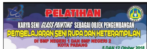
Gambar 10. Spanduk Pelatihan

Untuk memperlancar proses berkarya, sebaiknya sebelum memulai membuat karya terlebih dulu kita mempersiapkan semua peralatan dan bahan yang dibutuhkan ketika bekerja, seperti kuas, cat lukis, palet lukis, gunting, cutter, selotip, kapas, dan lainnya.