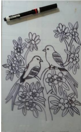
Gambar 5. Sket Burung