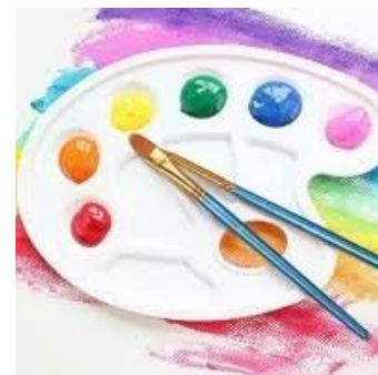
Gambar 1. Palet dan Kuas

Untuk memperlancar proses berkarya, sebaiknya sebelum memulai membuat karya terlebih dulu kita mempersiapkan semua peralatan dan bahan yang dibutuhkan ketika bekerja, seperti kuas, cat, palet cat, gunting, cutter, selotip, kapas, dan lainnya.