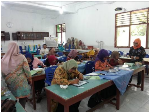
Gambar 12. Suasana Pelatihan Peserta Serious dalam Mengikuti Pelatihan