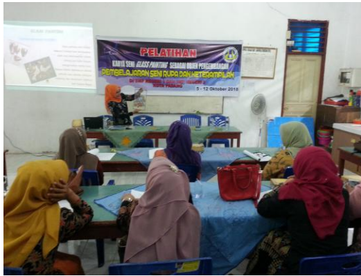
Gambar 11. Suasana Pelatihan Materi Teori