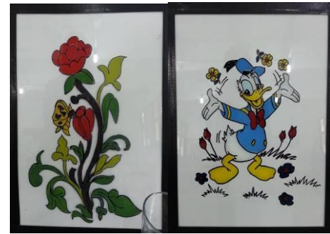
Gambar 13. Hasil Karya Pelatihan Praktek