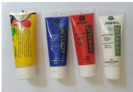
Gambar 6. Cat Acrylic

Jenis cat Transparent Vetro ini bersifat Transparan & Exclusive, sangat indah hasilnya karena menghasilkan warna warna yang cerah & transparan. Harganya cukup Mahal. Untuk Aplikasinya bisa langsung dikuaskan pada media kaca yang sudah dibersihkan. Apabila Terlalu kental/sudah mengental bisa dicairkan dengan Thinner . Cat ini digunakan apabila kita sudah mengerti teknik Glass Painting atau sudah berlatih dengan menggunakan Cat Opaque Coates .