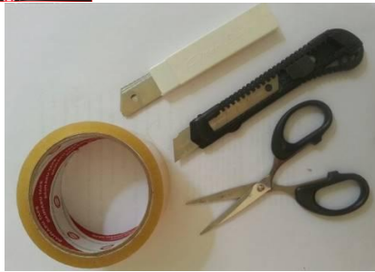
Gambar 2. Alat yang Digunakan