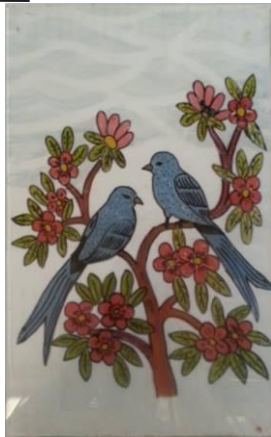
Gambar 8. Finishing