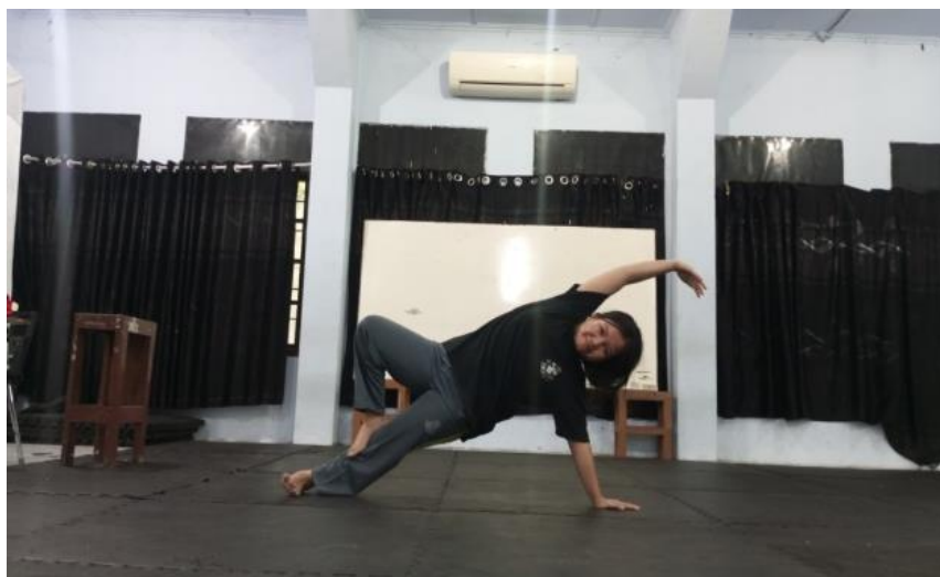
Gambar 2. Latihan Yoga untuk Melatih Keseimbangan

Dalam melatih ingatan emosi ini, pelatih mengarahkan penulis untuk benar-benar mengingat suatu peristiwa yang berkesinambungan dengan apa yang dibutuhkan tokoh di dalam naskah yang akan dimainkan. Lalu kemudian penulis menceritakan peristiwa apa yang diingat sedetail mungkin. Ketika mencoba mengingat pengalamannya dan mampu menguasai ingatan emosi tersebut, maka penulis akan menyimpan karena akan bermanfaat dan akan muncul dengan sendirinya saat penulis membutuhkan yang sepadan dengan apa yang dibutuhkan oleh tokoh.