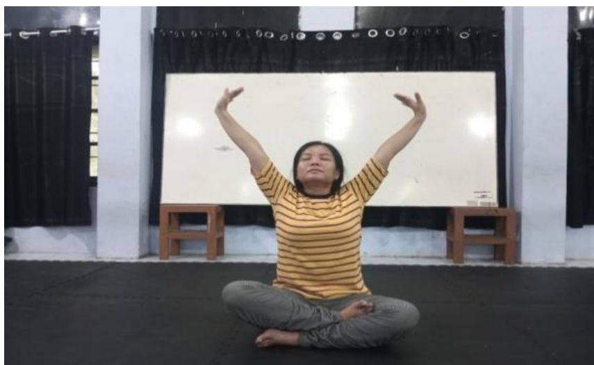
Gambar 1. Latihan Konsentrasi untuk Melatih Ingatan Emosi

Pada proses pertunjukan teater, penulis melakukan penciptaan karakter untuk memerankan tokoh Barabah dalam naskah Barabah karya Motinggo Busye sebagai salah satu syarat akhir dalam minat pemeranan. Dalam proses menciptakan tokoh penulis membutuhkan waktu untuk melakukan pencarian yang belum didapat dan tentunya menggali potensi yang dimiliki. Dalam proses penciptaan ini penulis menggunakan metode akting Lee Strasberg untuk menciptakan karakter tokoh Barabah pada naskah Barabah karya Motinggo Busye. Dalam buku The Lee Strasberg Notes terdapat banyak metode akting, akan tetapi penulis membatasi menjadi empat metode yaitu ingatan emosi, latihan tubuh, improvisasi dan pemanfaatan memori indera. Hal ini sebagai cara penulis dapat menciptakan karakter Barabah dalam naskah Barabah karya Motinggo Busye.