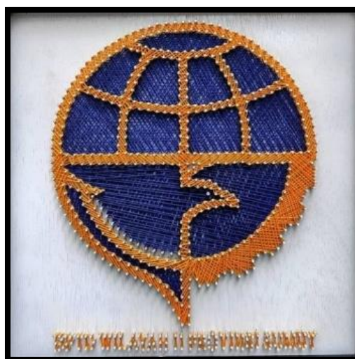
Gambar 3. String Art Logo

Setelah data dari penilai dikumpulkan dan dianalisis secara umum maka diketahui kerajinan string art hewan kucing tas ditinjau dari prinsip-prinsip desain mendapat predikat nilai cukup dengan jumlah nilai = 451 dengan rata-rata ( r ) = 75 (cukup).