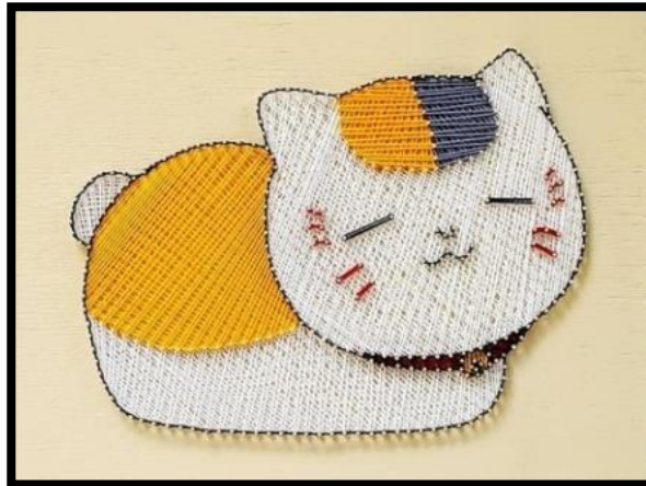
Gambar 2. String Art Hewan Kucing