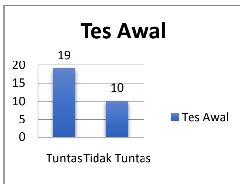
Tabel 1. Hasil Belajar Siswa Pada Saat Pretest

Berdasarkan data hasil tes Bahasa Indonesia materi Mendengarkan Pengumuman di atas dapat dilihat bahwa hasil belajar siswa dalam pembelajaran Bahasa Indonesia materi mendengarkan pengumuman masih rendah. Dari 29 orang siswa yang menjadi subjek