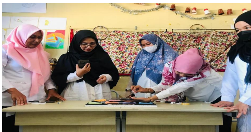
Gambar 3. Media TPACK Berupa Hologram

berbasis TPACK ( technology, paedagogyc, and content knowledge ), dimana media yang nanti akan dihasilkan oleh guru adalah media sederhana yang sarat akan ilmu pengetahuan basis konten/materi dan teknologi yaitu dengan membuat media hologram materi metamorfosis kupu-kupu dengan menggunakan teknologi scan QR dan video pembelajaran 3 Dimensi. Harapannya dengan guru terampil dalam membuat media berbasis TPACK, dapat diimplementasikan dalam pembelajaran disekolah masing-masing guru. Berikut adalah produk media pembelajaran berbasis TPACK melalui hologram dan video 3D yang dihasilkan dalam kegiatan PKM melalui gambar ini: