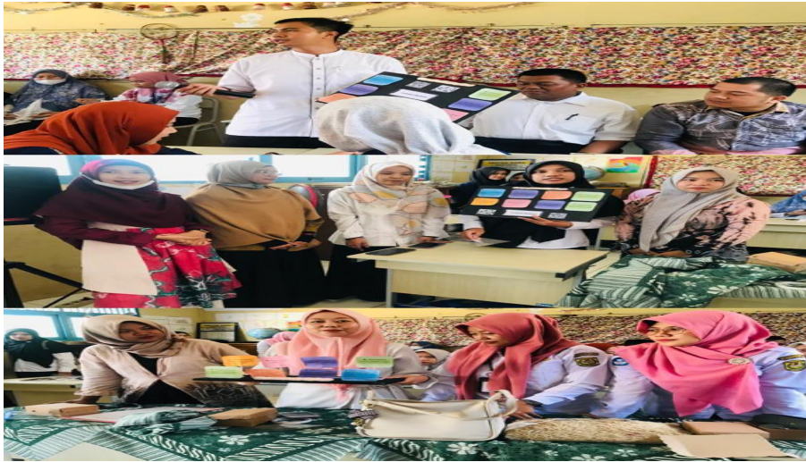
Gambar 4. Guru Mengkomunikasikan Hasil Proyek Media TPACK

oleh para guru, selain itu kegiatan presentasi untuk memperkuat dan mengembangkan cara guru mengkomunikasikan hasil proyeknya. Kegiatan guru dalam mendemonstrasikan kegiatan dapat dilihat pada gambar berikut ini.