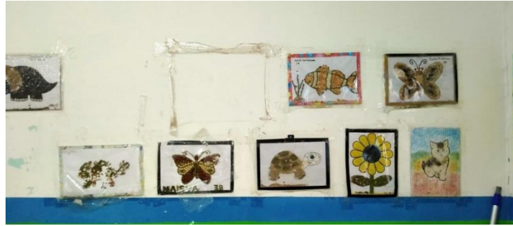
Gambar 2. Media Pembelajaran di Salah satu Sekolah Mitra

Berdasarkan permasalahan-permasalahan yang telah diungkapkan di atas, untuk meningkatkan profesionalisme guru diperlukan kegiatan pelatihan berupa merancang media pembelajaran inovatif berbasis teknologi sehingga dapat diimplementasikan dalam pengajaran. Oleh karena itu penulis mengangkat judul “Peningkatan Profesionalisme Guru Melalui Pelatihan Pembuatan Media Pembelajaran Inovatif Berbasis TPACK ( Technology, Paedagogic, Content, and Knowledge ) Bagi Guru Sekolah Dasar di Banjarmasin Utara.