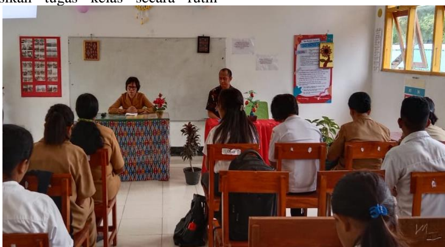
Gambar 3. Kepala Sekolah SD Inpres Lili mengarahkan guru-guru untuk mengontrol disiplin waktu peserta didik dengan pendelegasian tugas.

untuk dikerjakan peserta didik. Keteladanan guru terkait menghargai waktu sangat mempengaruhi perilaku disiplin peserta didik, di antaranya perilaku disiplin pemanfaatan waktu dengan benar (Suyudi & Wathon, 2020). Tugas-tugas yang telah diberikan guru harus dikontrol secara teratur untuk memastikan bahwa peserta didik menyelesaikan dan mengumpulkan tugas yang ada padanya sesuai batas waktu yang diperoleh. Hal tersebut merupakan upaya yang dapat ditempuh untuk membentuk karakter didiplin waktu dari peserta didik itu sendiri. Edukasi kepala sekolah kepada guru dalam mengontrol kedisiplinan waktu peserta didik melalui pendelegasian tugas dapat terlihat pada gambar 3.