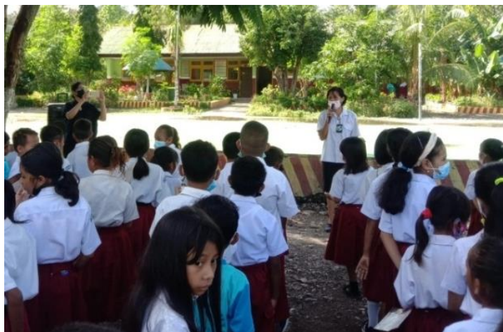
Gambar 2. Kepala Sekolah SD Inpres Lili memberi pemahaman pedagogis bagi peserta didik kelas V

2) Edukasi kepala sekolah kepada guru dalam mengontrol kedisiplinan waktu peserta didik melalui pendelegasian tugas. Kepala sekolah menjelaskan bahwa untuk meningkatkan karakter disiplin waktu peserta didik maka perlu adanya keterlibatan guru-guru yang mengawasi pola dan perilaku peserta didik, khususnya dalam hal pemanfaatan waktu secara tepat guna. Kepala sekolah mengungkapkan bahwa guru-guru merupakan figure yang harus menunjukkan keteladanan manajemen waktu dengan mewujudkan karakter kedisiplinan dalam penggunaan waktu secara optimal ketika melakukan berbagai aktivitas, khususnya dalam hal kemampuan mendelegasikan tugas kelas secara rutin