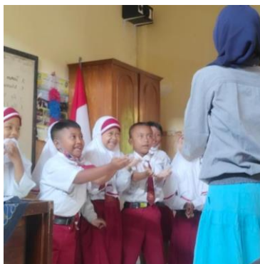
Gambar 1. Praktik tradisi udik-udikan

melalui Lembar Kerja Peserta Didik (LKPD). Peneliti mengambil permasalahan dengan melibatkan Tradisi Udik-udikan sebagai sarana dalam mengenalkan materi mata uang logam.