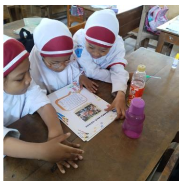
Gambar 2. Siswa berdiskusi

fasilitator di dalam pembelajaran. Peneliti mengamati setiap kegiatan yang dilakukan oleh siswa.