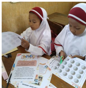
Gambar 4. Siswa menempel