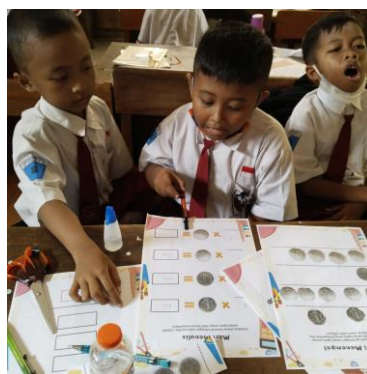
Gambar 5. Siswa menuliskan hasil dalam bentuk angka

Tidak hanya sampai disitu, kegiatan selanjutnya siswa diharuskan menjumlahkan total hasil uang logam yang telah mereka