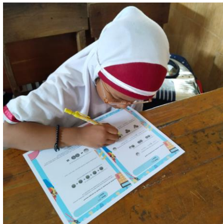
Gambar 7. Siswa mengerjakan soal evaluasi

Siswa : Seru bu, ada menggunting-mengguntingnya. Tadi juga asyik sewaktu ke depan kelas main udik-udikan.