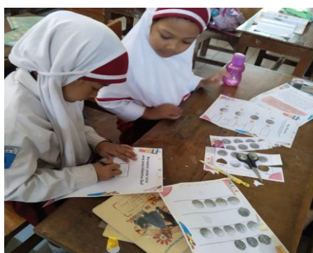
Gambar 6. Siswa menjumlahkan hasil

tulis pada aktivitas sebelumnya. Hasil dari hitungan tersebut juga dituliskan dalam bentuk angka.