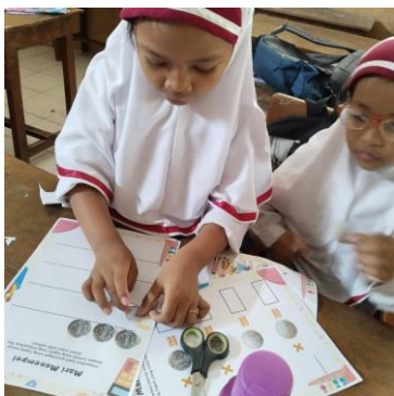
Gambar 3. Siswa menggunting

menggunting dan menempel dalam bentuk angka.