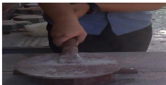
Gambar 2. Pemukulan Pada Benda Uji