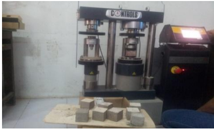
Gambar 6. Pengujian Kuat Tekan Paving Block

Pada paving block yang dikeringkan secara alami 7 hari, untuk sampel no.1 dengan semen portland 100% dan tanpa bahan campuran limbah bata merah maka ditimbang berat benda seberat 188 gram kemudian diuji kuat tekannya dan didapat nilai kuat tekannya sebesar 1,85 Mpa yang dapat digunakan sebagai tempat parkir kendaraan. Untuk sampel no.2 dengan semen portland 70% dan limbah bata merah 30% maka ditimbang berat benda seberat 186 gram kemudian diuji kuat tekannya dan didapat nilai kuat tekannya sebesar 1,49 Mpa yang dapat digunakan sebagai trotoar. Untuk sampel no.3 dengan semen portland 50% dan limbah bata merah 50% maka ditimbang berat benda seberat 176 gram kemudian diuji kuat tekannya dan didapat nilai kuat tekannya sebesar 1,13 Mpa yang dapat digunakan sebagai taman kota. Untuk sampel no.4 dengan semen portland 70% dan limbah merah 30% maka ditimbang berat benda seberat 166 gram kemudian diuji kuat tekannya dan didapat nilai kuat tekannya sebesar 0,60 Mpa, tidak dapat digunakan. Untuk sampel no.5 dengan limbah bata merah 100% dan tanpa bahan campuran semen portland didapat berat benda sebesar 162 gram namun tidak dapat ditentukan hasil nilai kuat tekannya karena benda uji hancur dalam tahap perawatan. Sehingga dapat disimpulkan bahwa semakin banyaknya campuran limbah bata merah pada pembuatan paving block maka kuat tekannya semakin menurun.