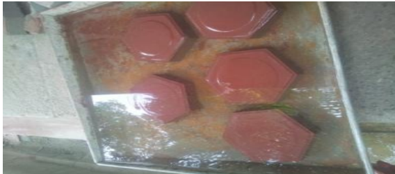
Gambar 4. Perendaman Paving Block

Daya serap pada paving block dalam bentuksegienam, untuk sample 1 dengan menggunakan semen portland 100% tanpa bahan campuran limbah bata merah, maka didapat timbangan berat basah benda uji 2321 gram, berat kering benda uji 2020 gram, dan didapat nilai penyerapan air sebesar 14,90 %. Untuk sample 2 dengan menggunakan semen portland 70% dan campuran limbah bata merah 30%, maka didapat timbangan berat basah benda uji 2375 gram, berat kering benda uji 2134 gram, dan didapat nilai penyerapan air sebesar 11,29 %. Untuk sample 3 dengan menggunakan semen portland 50% dan campuran limbah bata merah 50%, maka didapat timbangan berat basah benda uji 2325 gram, berat kering benda uji 2114 gram, dan didapat nilai penyerapan air sebesar 9,98 %. Untuk sample 4 dengan menggunakan semen portland 30% dan campuran limbah bata merah 70%, maka didapat timbangan berat basah benda uji 2101 gram, berat kering benda uji 1642 gram, dan didapat nilai penyerapan air sebesar 27,95 %. Untuk sample 5 dengan menggunakan limbah bata merah 100% tanpa bahan campuran semen portland, maka didapat timbangan berat basah benda uji 2090 gram, berat kering benda uji 1696 gram, dan didapat nilai penyerapan air sebesar 23,23 %.