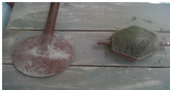
Gambar 1. Kondisi Awal Sebelum Pemukulan

Komposisi bahan pembuatan paving block untuk sample 1 dengan menggunakan semen portland 100% tanpa bahan campuran limbah bata merah pada lapis I digunakan campuran semen portland 340 gram dan oker 170 gram dan pada lapis II digunakan campuran semen portland 340 gram dan pasir 1360 gram. Untuk sample 2 dengan menggunakan semen portland 70% dan limbah bata merah 30% pada lapis I digunakan campuran semen portland 340 gram dan oker 170 gram dan pada lapis II digunakan campuran semen portland 238 gram, limbah bata merah 102 gram dan pasir 1360 gram. Untuk sample 3 dengan menggunakan semen portland 50% dan limbah bata merah 50% pada lapis I digunakan campuran semen portland 340 gram dan oker 170 gram dan pada lapis II digunakan campuran semen portland 170 gram, limbah bata merah 170 gram dan pasir 1360 gram. Untuk sample 4 dengan menggunakan semen portland 30% dan limbah bata merah 70% pada lapis I digunakan campuran semen portland 340 gram dan oker 170 gram dan pada lapis II digunakan campuran semen portland 102 gram, limbah bata merah 340 gram dan pasir 1360 gram. Untuk sample 5 dengan menggunakan limbah bata merah 100% dan tanpa campuran. Pada lapis I digunakan campuran semen 340 gram dan oker 170 gram dan pada lapis II digunakan campuran limbah bata merah 340 gram dan pasir 1360 gram. Untuk pengujian daya serap digunakan cetakan berukuran segienam dan pengujian kuat tekan digunakan cetakan ukuran 5x5 cm.