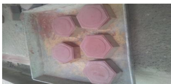
Gambar 3. Perawatan Paving Block

Setelah benda uji dilepas dari cetakan maka dilakukan perawatan dengan cara dikeringkan selama 7 hari, kemudian disiram merata dan dibiarkan kering dengan suhu udara kamar ( 20^{\circ} - 25^{\circ} \text{C} ) sampai batas umur 7 hari sesudah pencetakan, paving block siap diuji kuat tekannya. Pengujian benda uji pada penelitian ini hanya dilakukan saat paving block mencapai umur 7 hari.