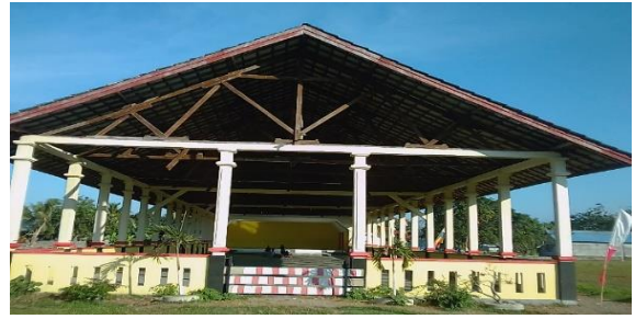
Gambar 3. Gedung Kesenian di Pulau Buru

Gambar 2 menunjukkan Sawah yang dibuat eks orang-orang buangan. Guna mengairi sawah, mereka membendung sungai Waetele. Alat yang dipergunakan untuk bekerja yaitu linggis, cangkul, dan sekop. Sebagai hasilnya mereka dapat mengalirkan air sedikit demi sedikit ke sawah.