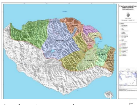
Gambar 1. Peta Kabupaten Buru (Sumber: www.burukab.go.id.20 )

Kabupaten Buru terletak antara 2°25' – 3°83' Lintang Selatan dan 125°08' – 127°20' Bujur Timur. Luas Kabupaten Buru wilayah Kabupaten Buru adalah 7.595,58 km 2 yang terdiri dari luas daratan 5.577,48 km 2 dan luas lautan/perairan 1.972,50 km 2 dengan panjang garis pantai 232,18 km 2 . Secara Geografis Kabupaten Buru memiliki batas wilayah dengan Laut Seram di utara, Kabupaten Buru Selatan & Laut Banda di selatan dan Barat, serta selat Mani di timur ( www.burukab.go.id.2018 ).