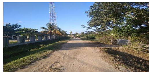
Gambar 1. Jalan pertama yang pernah dilalui oleh eks orang-orang buangan menuju ke Wae Apo.