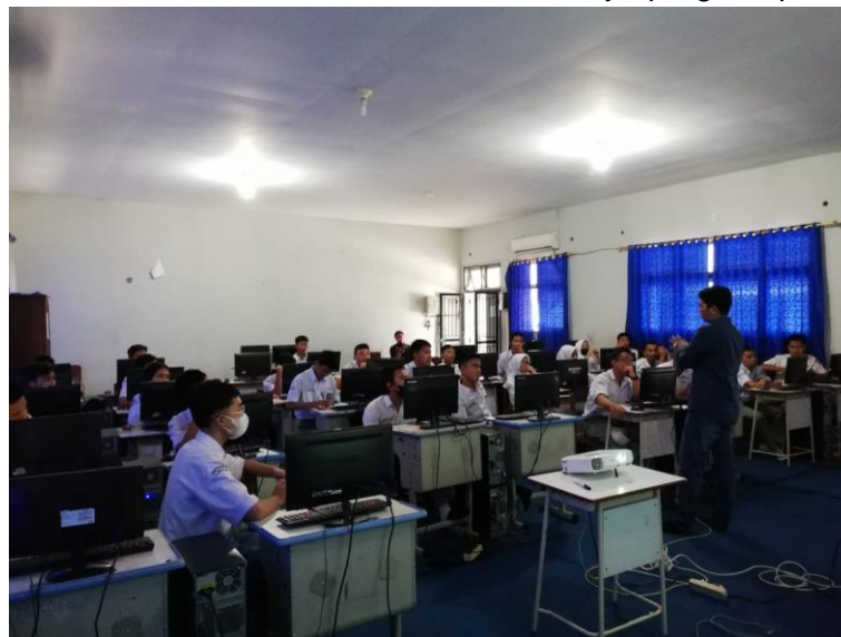
Gambar 3. Penjelasan mengenai aplikasi perangkat lunak pada menggambar teknik bangunan dan penggalan kemampuan awal mitra.

sederhana yang dapat menjadi acuan dalam penggunaan aplikasi AutoCAD. Dengan menyediakan sumber daya tambahan ini, diharapkan mitra dapat mempertahankan dan memperdalam pemahaman mereka, sekaligus memiliki referensi praktis yang dapat diakses kapan saja ketika diperlukan. Seluruh rangkaian tahapan ini bertujuan tidak hanya untuk memberikan pengetahuan teknis, tetapi juga untuk membangun keterampilan praktis dan memberikan dukungan berkelanjutan bagi mitra setelah selesainya program pelatihan.