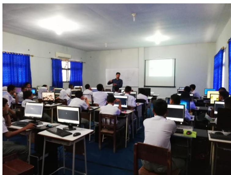
Gambar 4. Proses kegiatan pelatihan menggunakan aplikasi AutoCAD.