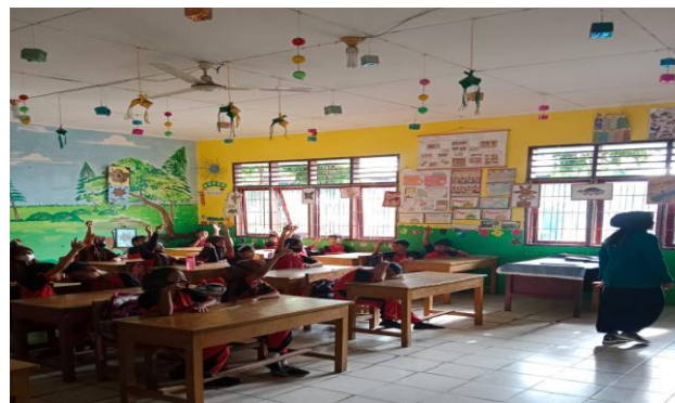
Gambar 1 Proses Penerapan Model Pembelajaran Think Talk Write (TTW)

Dari 30 siswa terdapat 24 siswa dengan persentase 80% yang mencapai nilai kemampuan berpikir kritis sedangkan siswa yang mencapai nilai kemampuan cukup kritis sebanyak 4 orang siswa dengan persentase 13% dan terdapat 2 siswa dengan persentase 7% mencapai nilai kemampuan kurang kritis. Sehingga dapat disimpulkan nilai rata-rata kelas eksperimen pretest 47,90 dengan kategori kurang kritis sedangkan nilai rata-rata posttest 71,80 dengan kategori kritis. Pada kelas kontrol nilai rata-rata pretest 34,63 dengan kategori tidak kritis sedangkan nilai rata-rata posttest 39,97 dengan kategori tidak kritis. Hasil uji normalitas dapat dilihat pada tabel 3 dan hasil uji coba homogenitas dapat dilihat pada tabel 4.