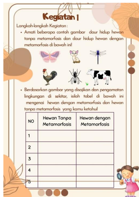
Gambar 3. Kegiatan Praktek (Kelompok) LKPD