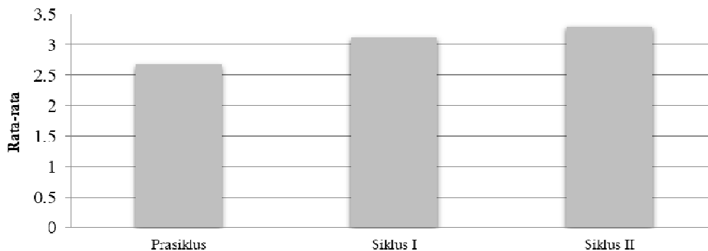
Gambar 3. Peningkatan nilai rata-rata kompetensi keterampilan dari prasiklus, siklus I dan siklus II

Hasil analisa kompetensi keterampilan secara keseluruhan menunjukkan kenaikan dari prasiklus dengan nilai rata-rata 2,68 mengalami peningkatan pada perlakuan siklus I sebesar 3,12 sedangkan perlakuan siklus II