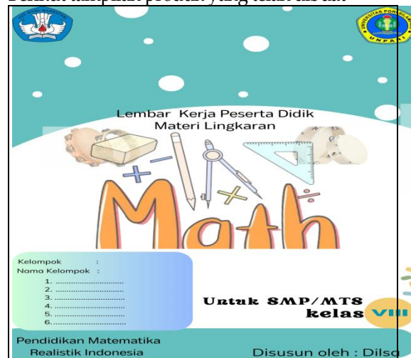
Gambar 1: Gambaran cover produk LKPD

Berikut tampilan produk yang telah dibuat