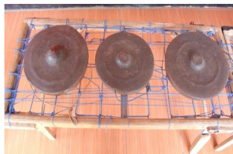
Gambar 4: Meko Ina/inak .

diameter yang berbeda-beda. Hal ini sangat berpengaruh kepada bunyi yang dihasilkan. Berikut adalah ukuran berdasarkan jenis Gong Rote :