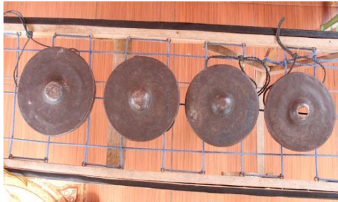
Gambar 6: Meko ana .

bungsu). Kedua buah gong ini memiliki ukuran diameter yang berbeda dimana nggasak/nggasa lain/laik berukuran 27 cm dengan ketebalan 5,5 cm, Sedangkan nggasak/nggasa daek/daen berukuran 26 cm dengan ketebalan 4 cm.