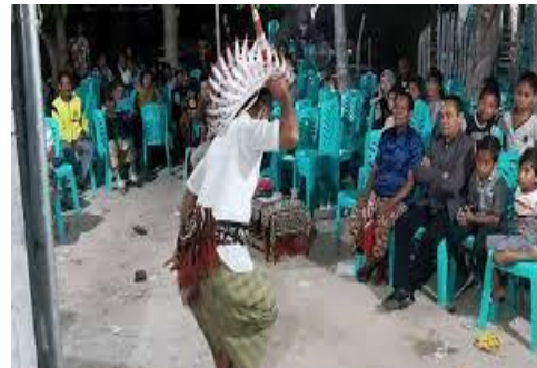
Gambar 1. Pertunjukan tarian foti bobouk .

menampilkan gerakan yang tangkas dan cepat serta penuh semangat. Hela atau pela atau Ndara/Ndala juga merupakan tarian kemenangan dalam perang seperti halnya babouk . Namun gerakan yang ditampilkan lebih cepat ( tempo ) dan lebih tangkas dari bobouk . Kaka atau kaka musuh merupakan tarian dalam medan perang. Jika bobouk dan Hela merupakan bentuk ungkapan kegembiraan atas kemenangan yang diperoleh, maka tarian kaka atau kaka musuh merupakan tarian yang ditampilkan sementara peperangan terjadi. Busana yang digunakan oleh penari hampir sama dengan tarian bobouk dan hela , hanya saja pada tarian kaka musu ditambah dengan aksesoris parang (Haning, 2009). Terlepas dari jenis-jenis tarian foti tersebut, dalam penelitian ini peneliti akan lebih fokus kepada jenis tarian foti bobouk sebagai objek penelitian.