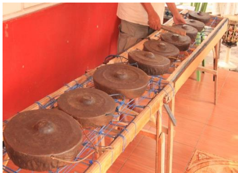
Gambar 2. Gong Rote (meko) .

satu buah gong tambahan. Gong Rote (meko) tidak dapat berfungsi jika tidak ada tambur ( labu ). Bahan dasar yang digunakan untuk membuat tambur ( labu ) adalah batang kayu pohon kelapa yang berfungsi sebagai tabung suara atau resonansi, sedangkan untuk membrannya dibuat dari kulit rusa (Haning, 2009). Sejarah penemu Gong Rote (meko) dan tambur ( labu ) masing-masing adalah Liti Leang dan Batu Leang (Haning, 2012).