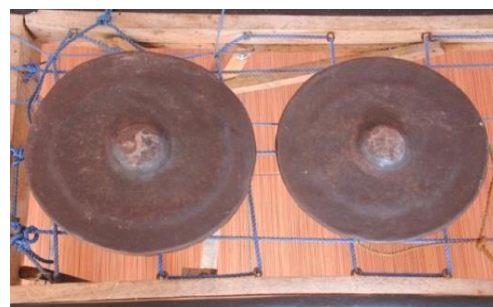
Gambar 5: Meko Nggasa/nggasak .

Meko Ina atau Gong ibu merupakan kelompok gong yang beriksan tiga buah gong yaitu; ina makamu (ibu/mama sulung) ; ina taladak (ibu/mama tengah) ; dan ina tataik (ibu/mama bungsu) . Ketiga buah gong ini memiliki ukuran dan ketebalan yang berbeda antara satu dengan yang lain. ina makamu memiliki ukuran 32 cm dengan ketebalan 5,5 cm, ina taladak memiliki ukuran 34 cm dengan ketebalan 7,5 cm, ina tataik memiliki ukuran 30 cm dengan ketebalan 6 cm.