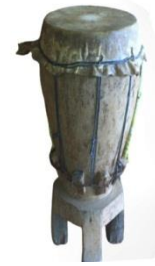
Gambar 7: Tambur ( labu ).

berfungsi sebagai membrannya dengan ukuran lingkaran sekitar 24 cm.