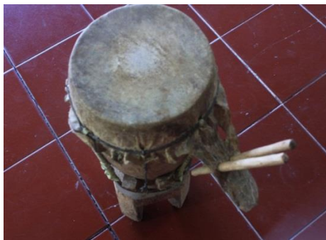
Gambar 3. Tambur ( labu ).