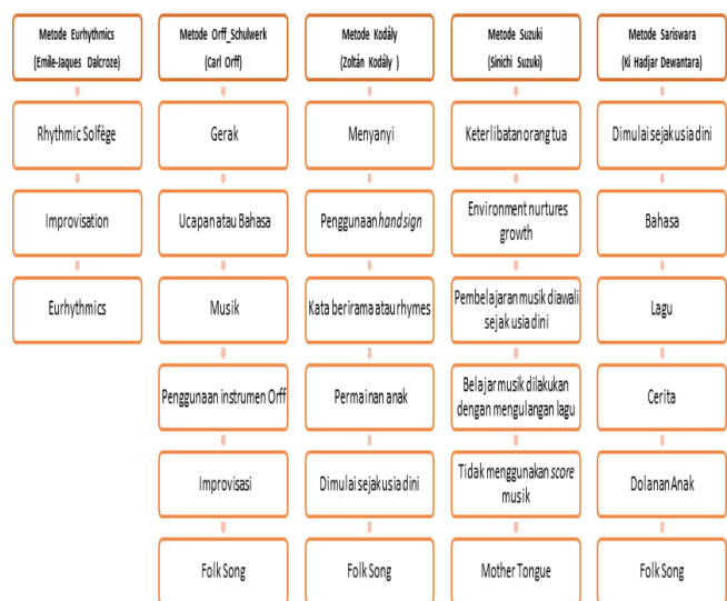
Tabel 2. Metode Pendidikan Musik

Pada tabel diatas, diketahui bahwa aktivitas yang dirancang masing-masing pendidik musik memiliki kemiripan. Rata-rata pendidikan musik disarankan dimulai sejak usia dini, menggunakan lagu (musik yang memiliki unsur bahasa), gerak, dan permainan anak. Metode pengajarannya hampir mirip dengan metode Sariswara. Aktivitas pembelajaran dari masing-masing